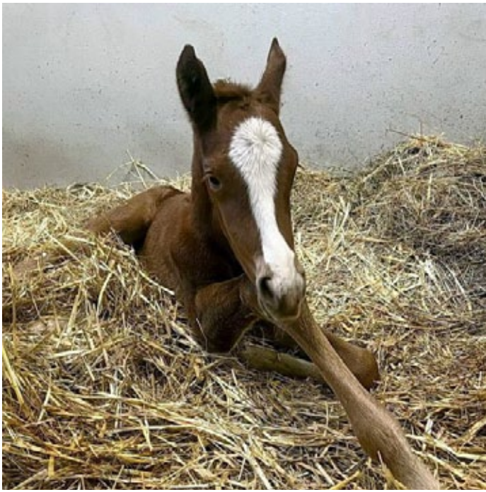
Papakind: Ihren Vater Masar kann diese hübsche kleine Dame in Farbe und Abzeichen wohl nicht verleugnen, die Ebbesloherin Wolkenburg (Big Shuffle) als Mutter ist nämlich einfarbig braun

Ein GAG von 90 kg erreichte Deia (Soldier Hollow) auf der Rennbahn, ihre rechten Geschwister waren noch um einiges erfolgreicher. Mit großer Erleichterung hat man im Gestüt Westerberg sicher die Nachricht aus Irland vom Erstling der Deia, einem Stutfohlen von Wootton Bassett , aufgenommen.