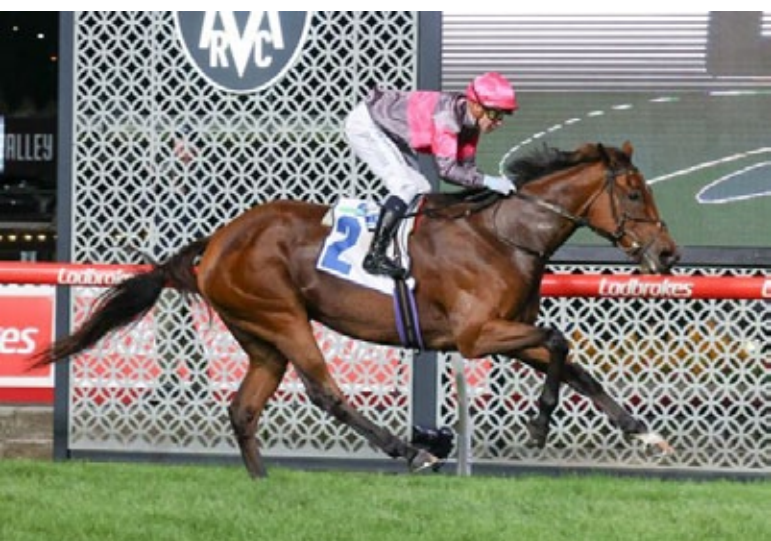
Sirileo Miss holt sich die Sunline Stakes.