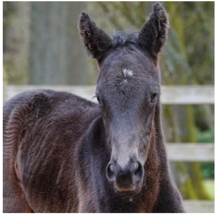
Diamant Nr. 2: Das zweite Fohlen der Dianasiegerin Diamanta (Maxios) ist dieser tolle Hengst von Camelot, jetzt geht es für die beiden nach Auenquelle zu Torquator Tasso

Das Gestüt Schlenderhan meldet ein Zarak -Stutfohlen der Walzerprinzessin (Monsun), de-