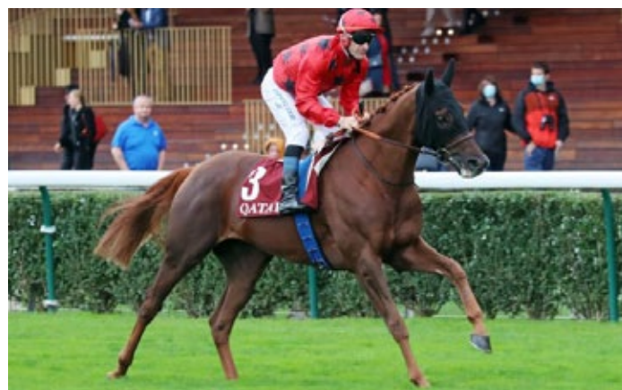
Ein alter Bekannter: The Revenant läuft im Prix Edmond Blanc.