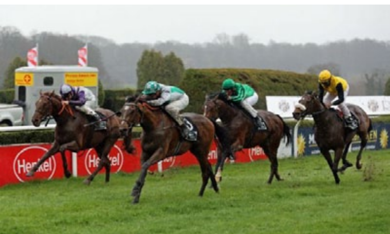
I Fight for Lips kommt gegen gute Konkurrenz sicher zum Zuge.

Ein Angebot der BBAG- Jährlingsauktion 2021