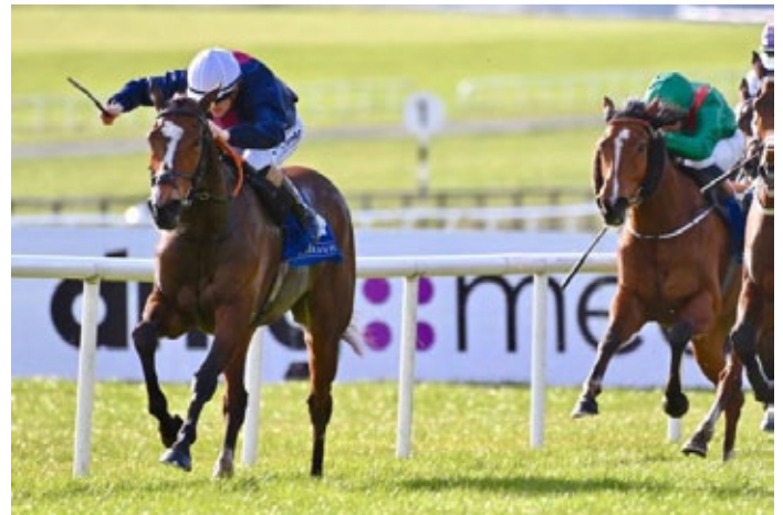
Insinuendo kommt als Favoritin zum Zuge.

Der einstige 110.000 Euro-Jährling von Goffs ist einer von 15 Gr.-Siegern ihres Vaters Gleneagles (Galileo), der für 17.500 Euro in Coolmore steht. Nachdem es mit seinen Nachkommen zunächst nicht ganz so aufregend lief, deckte der 2000 Guineas (Gr. I)-Sieger in England und Irland 2021 nur 31 Stuten, doch schoss diese Zahl im vergangenen