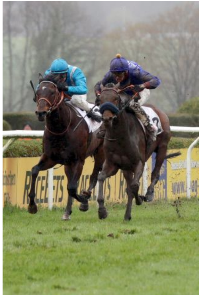
Difficult conditions in Düsseldorf: Assistent (r.) winning the listed race.

Last weekend we had the first black type race of the year in Germany, the listed Preis von Fortuna/Grand Prix Aufgalopp at Düsseldorf on what was easily the best card of the year so far in Germany. Once again we were spot on with our prediction, that Assistent (Sea The Moon) and Mansour (Tai Chi) were the two to follow, and they finished respectively first and second. As expected Mansour, a strong front-runner, set the pace and still had a comfortable lead coming into the straight. The rest were well bunched up. but Assistent came out of the pack with a strong late challenge and cut down the leader easily enough to take the lead well inside the final furlong and score by half a lengths and twelve (!); this was a pretty strong