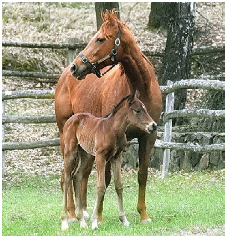
Fertig für 2023: Der jüngste Görlsdorfer des aktuellen Jahres ist dieser Time Test-Sohn der Gr.II-platzierten Snow (Sea The Moon) – auf dem Foto 16 Stunden alt

Über eine dreifache Verstärkung der Fohlenherde darf man sich im Gestüt Hachtsee freuen, darunter ein Zelzal -Stutfohlen der Gr.II-platzierten Taraja (High Chaparral) und ein Cloth of Stars -Stutfohlen der Gr.III-platzierten Ivanka (Dabirsim).