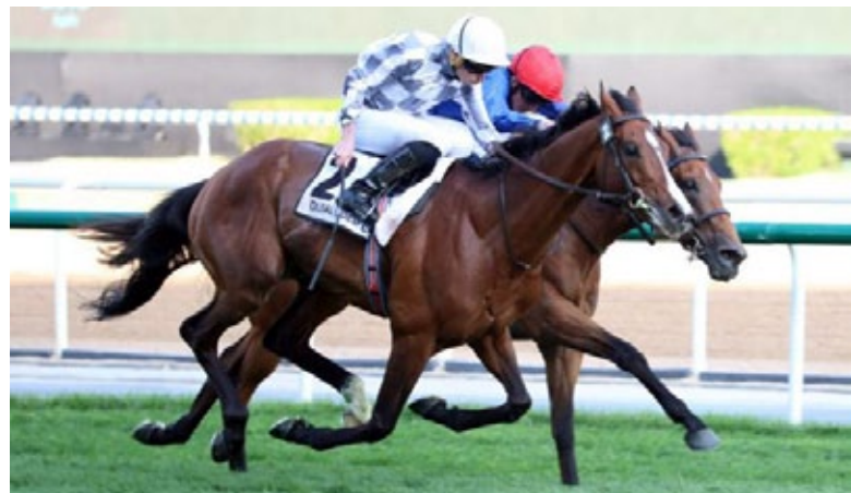
Broome kommt am Ende noch sicher an Siskany vorbei.

Als einziger deutscher Teilnehmer war Sisfahan (Isfahan) an diesem Tag angetreten, zum Kurs von 40:1. Am Ende wurde er im 16köpfigen Feld Siebter, wobei eingangs der Zielgeraden nach einem Rennen auf Warten kurz etwas mehr drin zu sein schien, doch wurde ihm der Weg dann doch etwas zu weit. Immerhin gab es noch 10.000 Dollar Preisgeld. Möglicherweise geht es mit ihm jetzt nach einer kurzen Pause in die deutschen Grand Prix-Rennen.