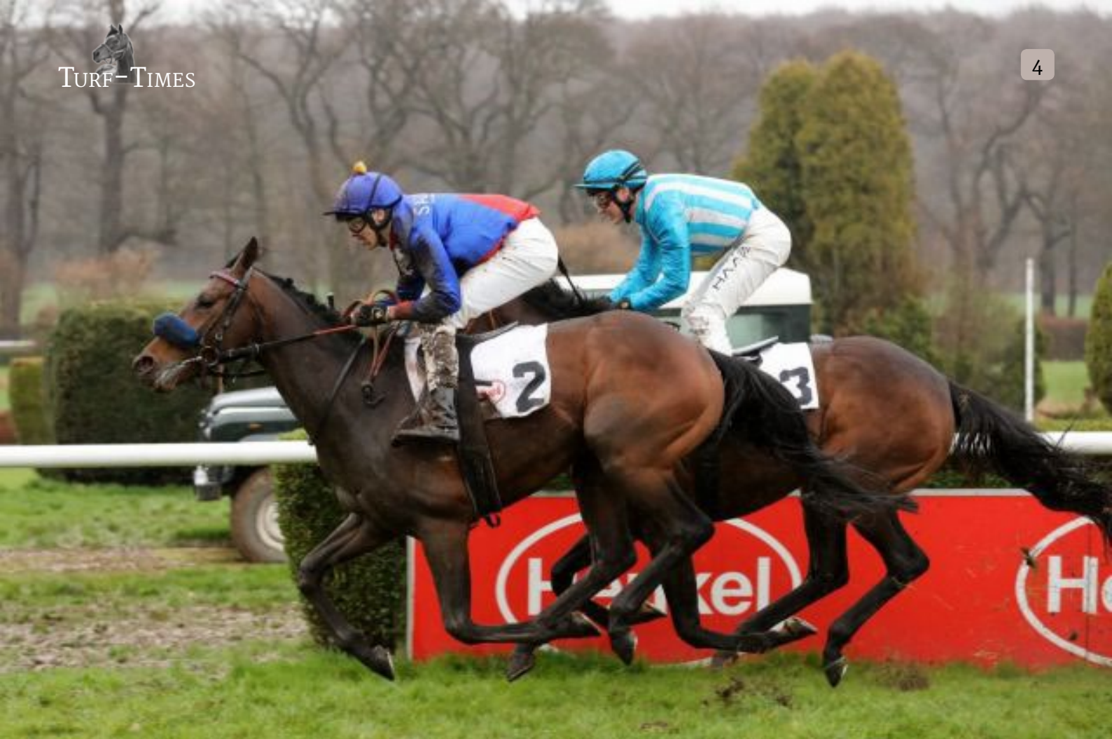
Assistent setzt sich gegen den Vorjahressieger Mansour durch.