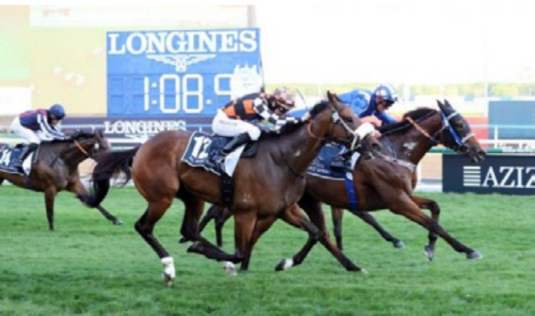
Der Außenseiter Danyah kommt in einem knappen Finish zum Zuge.

Eine der größten Überraschungen des Tages war der Sprint-Sieg von Danyah (Invincible Spirit), der zu entsprechend hoher Quote zum Zuge kam. Es war der erste Gr.-Sieg überhaupt für den Wallach, der einige Jahre von Owen Burrows trainiert wurde. In Großbritannien hatte er eine Handvoll besserer Handicaps über kurze Strecken gewonnen, so im Juli 2021 in Ascot. Es war jetzt sein erster Winter in Dubai für Trainer Musabbah Al Mheri , Mitte Februar war er in Meydan in einem