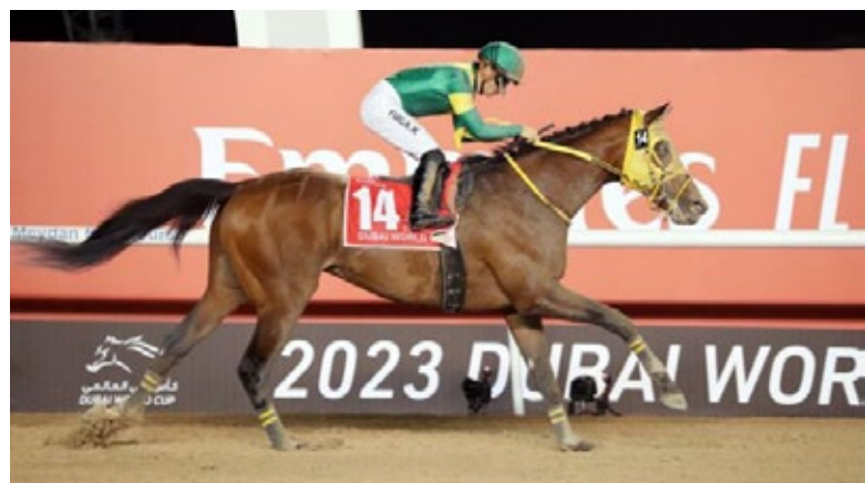
Ushba Tesoro ist ein am Ende souveräner World Cup-Sieger.

Sein Vater Orfevre (Stay Gold), aktuell für umgerechnet rund 25.000 Euro auf Shadai tätig, Champion in seiner Heimat, zweimal Zweiter im "Arc", ist Vater von bisher 25 Blacktype-Siegern, von denen sich rund ein Drittel diesen Status auf Sand verdient hat. Seine Tochter Marche Lorraine