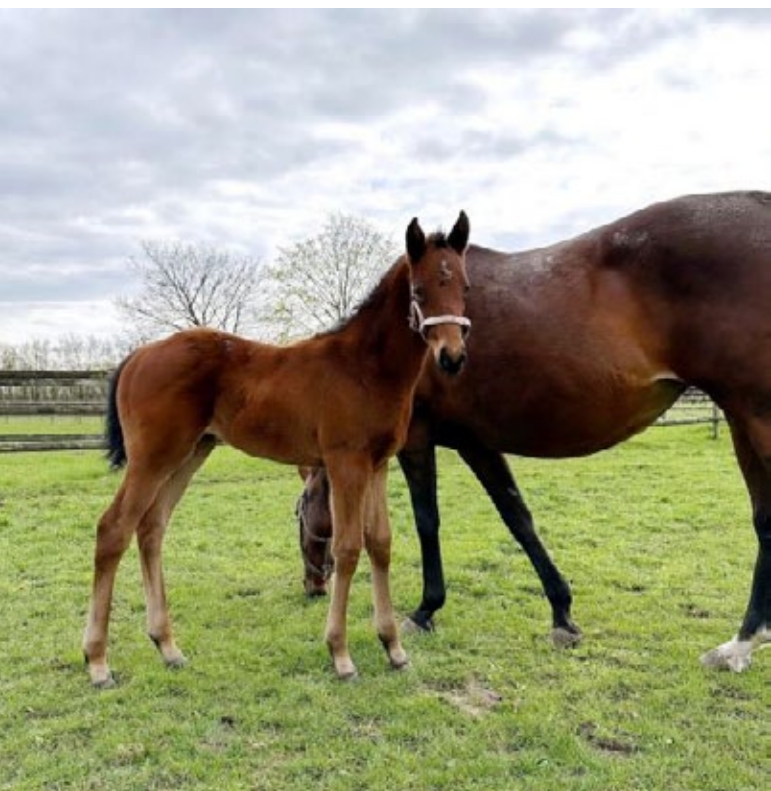
Drei Wochen alt: Vater Derbysieger (Isfahan), Mutter Gr.I-Siegerin (Sortilege v. Tiger Hill), Bruder Gr.-Sieger (Sirjan), da kann ja eigentlich nichts mehr schief gehen mit diesem schönen Karlshofer Stutfohlen