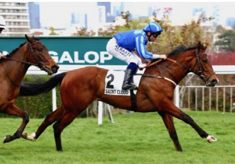
Myconian ist der erste Sieger von Magna Grecia.