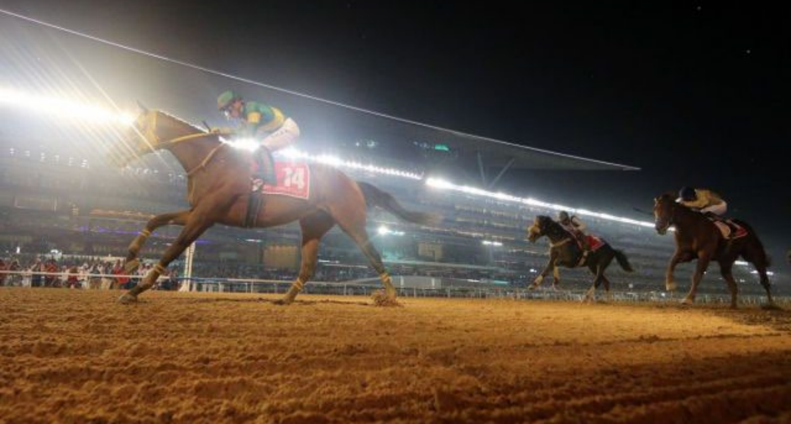
Japan holt sich den World Cup: Ushba Tesoro gewinnt vor beeindruckender Kulisse.