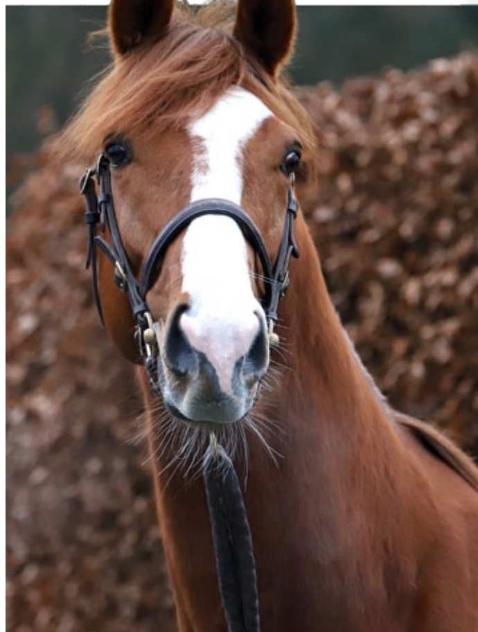
Nerik vor einigen Wochen in Röttgen.

Douala (2007), v. Dubawi – Desca v. Cadeaux Genereux, trgd. v. Magna Grecia