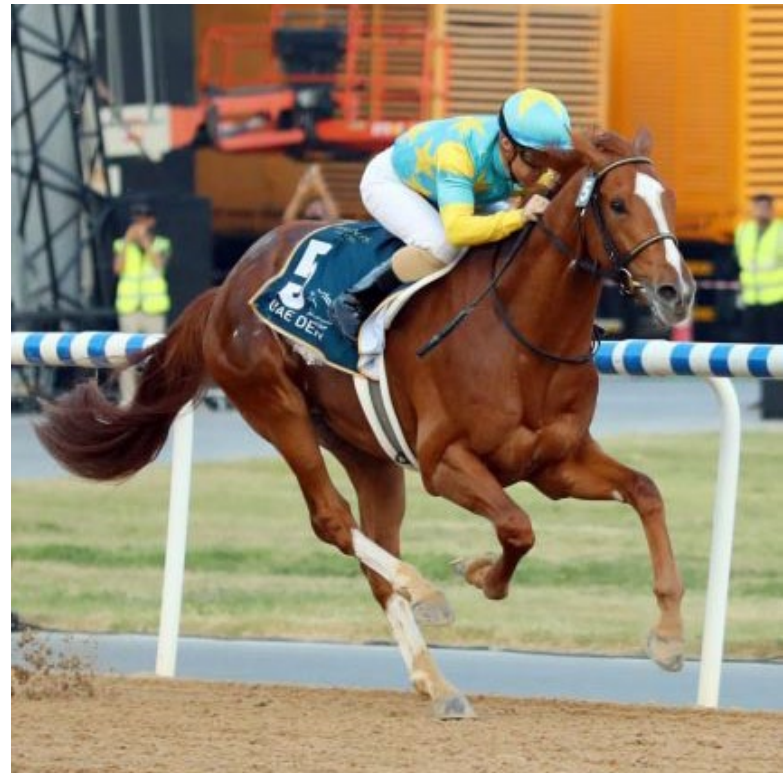
Von Meydan nach Churchill Downs: Für Derma Sotogake geht es jetzt in das Kentucky Derby.