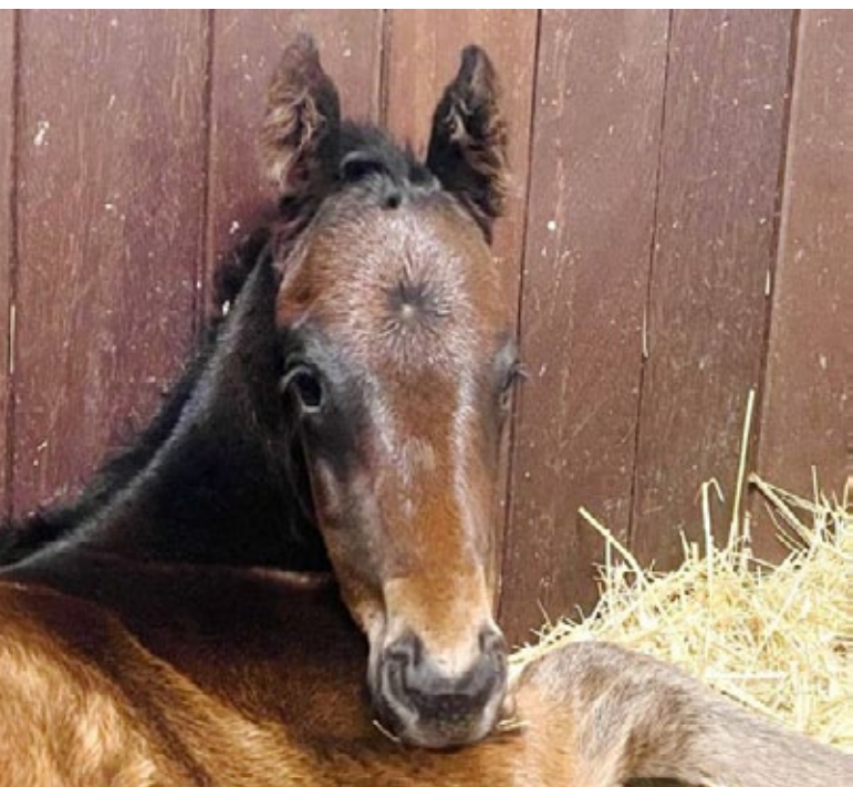
Prinzlicher Nachwuchs: Princess Alba (Lando) ist die Mutter dieses feinen Hengstfohlens, der Prinz von Auersperg ist der Züchter. Brametot als Vater tanzt da fast etwas aus der Reihe ;-)