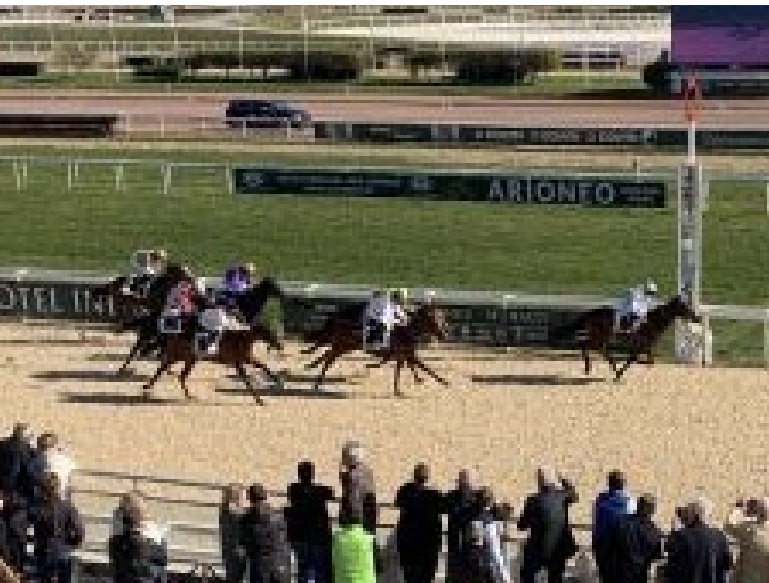
Brave Emperor gewinnt souverän den "Californie".

Einst gehörten Rennställe aus Großbritannien zu den Stammgästen der Rennen in Cagnes-sur-mer. Was auch daran lag, dass in den 80er und 90er Jahren Allwetterbahnen auf der Insel und auch in Frankreich noch nicht existent oder gerade im Aufbau waren. Wer in den Wintermonaten