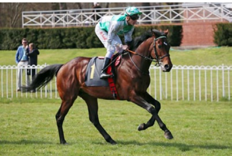
Best of Lips im April in Hoppegarten.

Nutan (Duke of Marmalade). Ihr Erstling I fight for Lips (Ulysses) ist zweijährig platziert gelaufen, er ist noch mit einer Derby-Nennung ausgestattet.