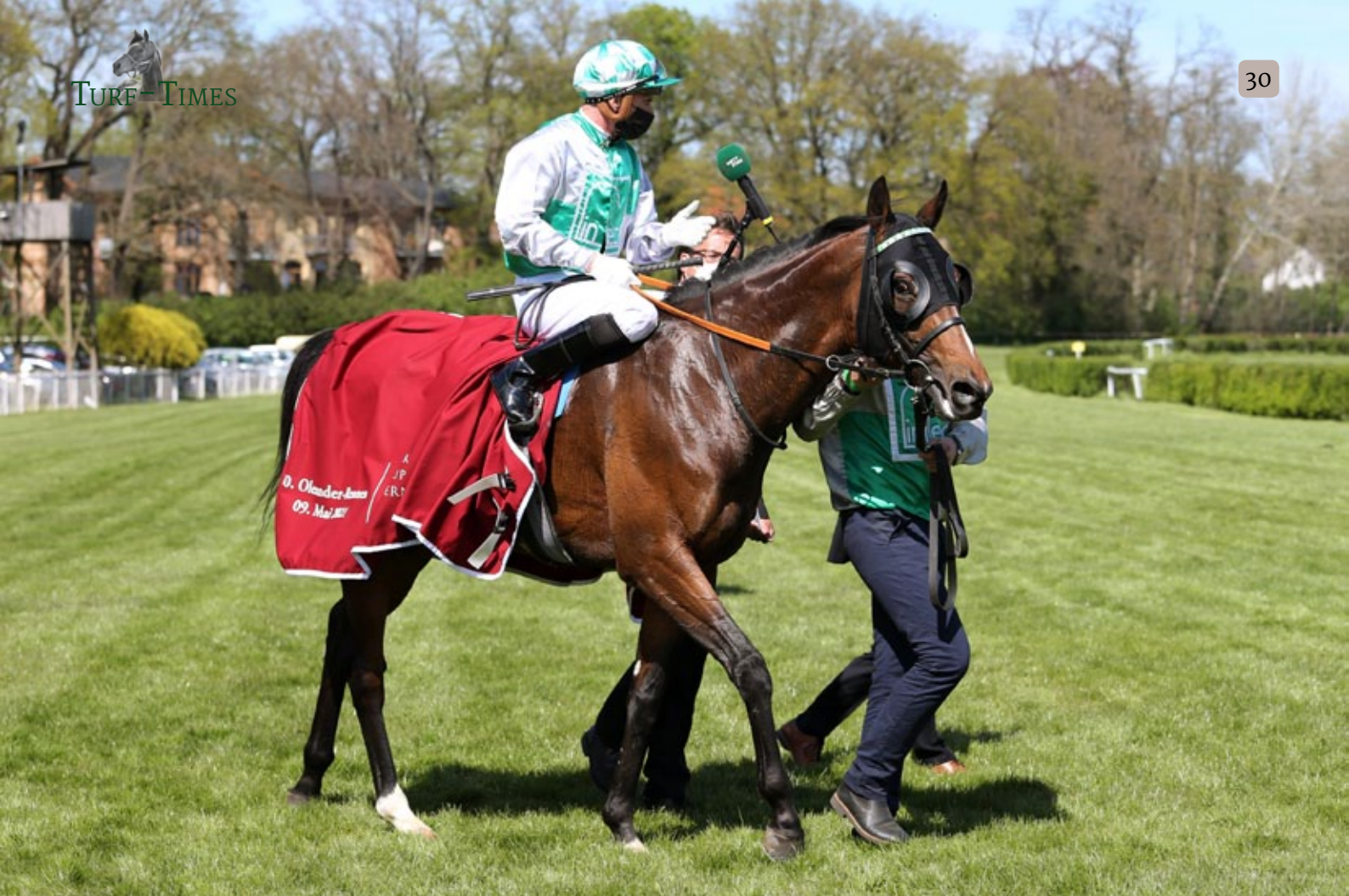
Rip van Lips unter Gerard Mossé nach seinem Sieg im Oleander-Rennen.

PROTECTIONIST (2010), v. Monsun – Patineuse v. Peintre Celebre (Gestüt Röttgen)