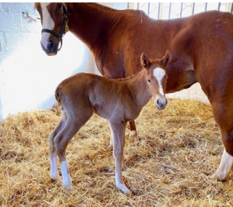
Eine Röttgenerin ist diese bunte junge Dame. Millowitsch ist der Vater des Fohlens, die Farbe hat sie aber von ihrer Mutter Anna Jolie (Jukebox Jury)