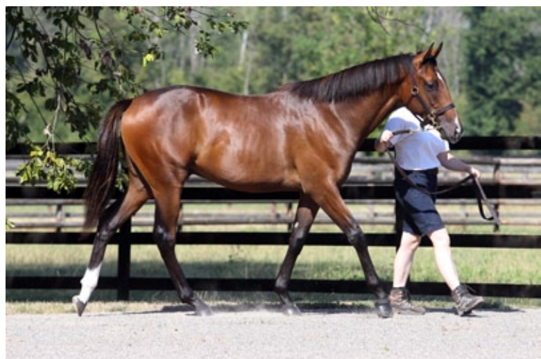
Diabolical Lips ging bei der BBAG nach Tschechien.

Devilish Lips , in Listenrennen zehnmal ins Geld gelaufen, hat bereits den mehrfachen Gr.-Sieger