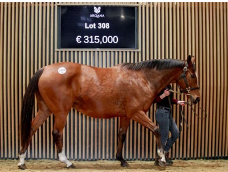
Rasmiya findet in Irland eine neue Heimat.

Eine von Mehmas tragende Galileo-Stute war zu einem Zuschlag von 315.000 Euro das teuerste Pferde der zweitägigen Vente Mixte de Février von Arqana zur Wochenmitte in Deauville. Die zehn Jahre alte Rasmiya (Galileo), Schwester von vier Blacktype-Pferden, Mutter der Listensiegerin Jouza (Toronado), ging für 315.000 Euro an die BBA Ireland. Die Agentur war noch zwei weitere Male in hochpreisigen Regionen unterwegs. Für 200.000 Euro erwarb sie aus dem Angebot des Aga Khan die nicht gelaufene, vier Jahre alte Zerziyna (Fastnet Rock) aus der Familie von Zarak (Dubawi), die zweite Mutter ist die "Arc"-Siegerin Zarkava (Zamindar). Auf 102.000 Euro kletterte die vier Jahre alte Majal (Shalaa), die wie Rasmiya vom Haras de Bouquetot angeboten wurde. Im Training bei Nicolas Clement hatte sie vergangenes Jahr in Angers gewonnen. Ihre Mutter Peaceful Love (Dashing Blade) ist Schwester der "Diana"-Siegerin Palmas (Lord of England). Eamon Reilly von BBA Ireland bekam den Zuschlag, es geht für sie wie für die beiden anderen als Zuchtstute nach Irland. Mutmaßlich wurde das Trio für Yulong Investments gekauft, denn dessen Deckhengst Lucky Vega wurde als möglicher Partner für die Stuten genannt.