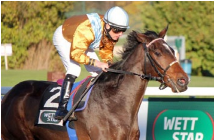
Wiesentau unter Jozef Bojko bei seinem Listensieg in München.

Mit drei Stuten aus der Waldrun-Familie wird im Gestüt Ravensberg gezüchtet, doch hat es im vergangenen Herbst bei der BBAG einen Ankauf mit Blickrichtung Zucht gegeben. Die jetzt zwei Jahre alte Anissa (Lord of England), die eine Box bei Andreas Wöhler bezogen hat, ist eine Schwester der Mutter der Gr. II-Siegerin Amazing Grace (Protectionist) aus der Anna Paola-Familie.