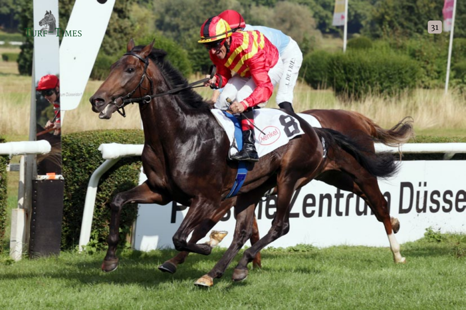
Postman aus der Matusche-Zucht gewinnt unter Andrasch Starke das BBAG-Auktionsrennen in Düsseldorf für den Stall Simply Red.