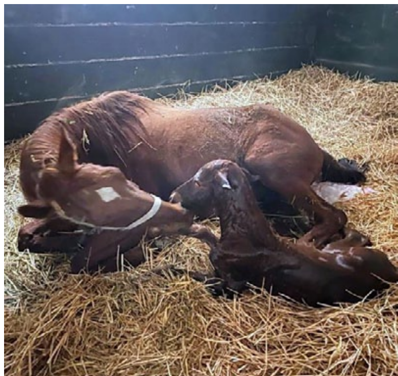
Kennenlernen: Irish Valley (Three Valleys) begrüßt ihr drittes Fohlen im Gestüt Hofgut Heymann. Der Vater des Stutfohlens ist Wild Chief