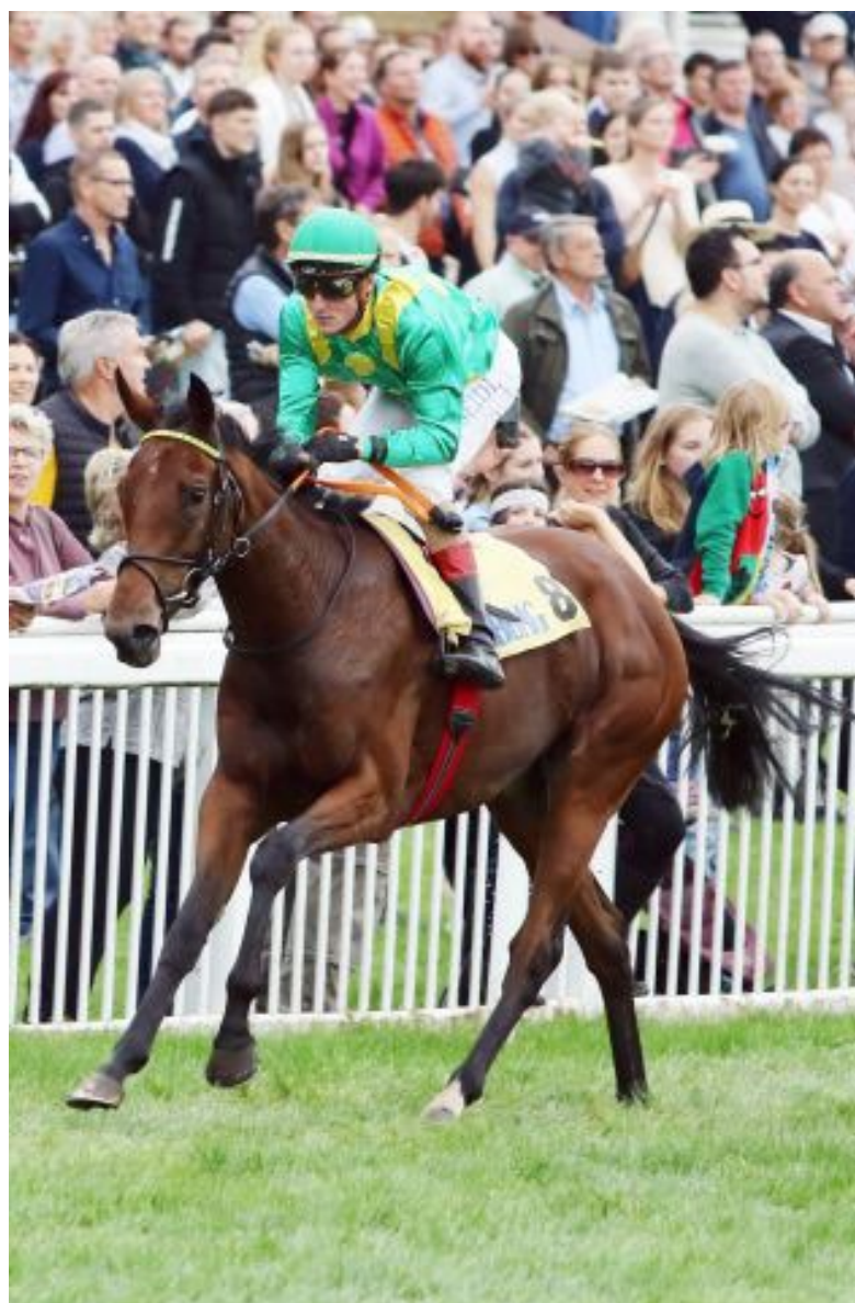
Quantanamera, Germanys best 2yo filly 2022.

This is clearly one of the problems with ante-post betting. One really needs to know for sure where the horse is going to run. In the case of the German Derby, still almost five months away, this obviously now the case. It also possible to supplement a horse at the beginning of Derby week; this is not cheap, costing the owner a cool 65,000 euros but there are plenty of optimists in racing. There was indeed a supplement last year, Queroyal who finished ninth; however he was only beaten about six lengths, so it could be said that it almost paid off. Queroyal's trainer Andreas Wöhler did however also a month later supplement the Australian-owned Toskana Belle (Shamalagan) for last year's Preis der Diana, and she brought home the bacon, so it can be done.