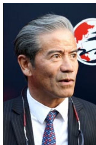
Tony Cruz.

Tony Cruz ist seit Sonntag der dritte Trainer, der eintausend Rennen auf Hong Kongs Premium-Rennbahn Sha Tin gewonnen hat. Den Jubiläumstreffer markierte Zac Purton im Sattel von Circuit Stellar. Der aus Portugal stammende Cruz, 66, vor Jahrzehnten auch in Deutschland im Rennsattel tätig, war sechsmal Champion-Jockey und zweimal Championtrainer in Hong Kong. Als Reiter war er in