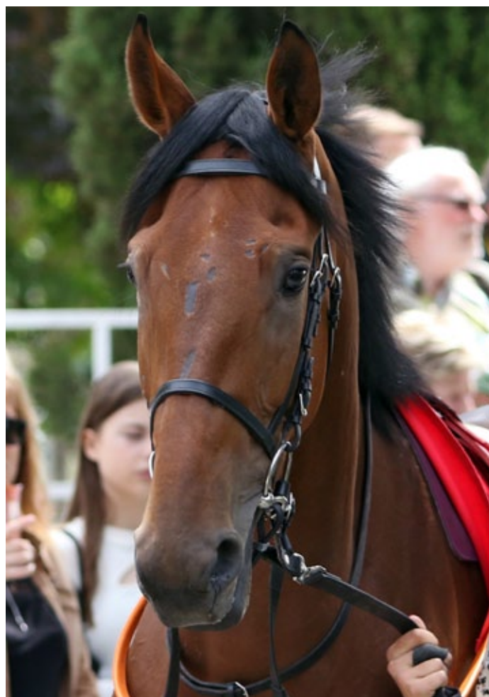
Beauty of Lips ist neu in der Herde.

Red Lips (2010), v. Areion – Rosarium v. Zinaad, trgd. v. Waldgeist