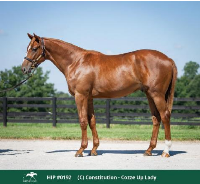
HIP #0192 (C) Constitution - Cozze Up Lady

Der Constitution-Hengst, der als Jährling 1,3 Millionen Dollar kostete.