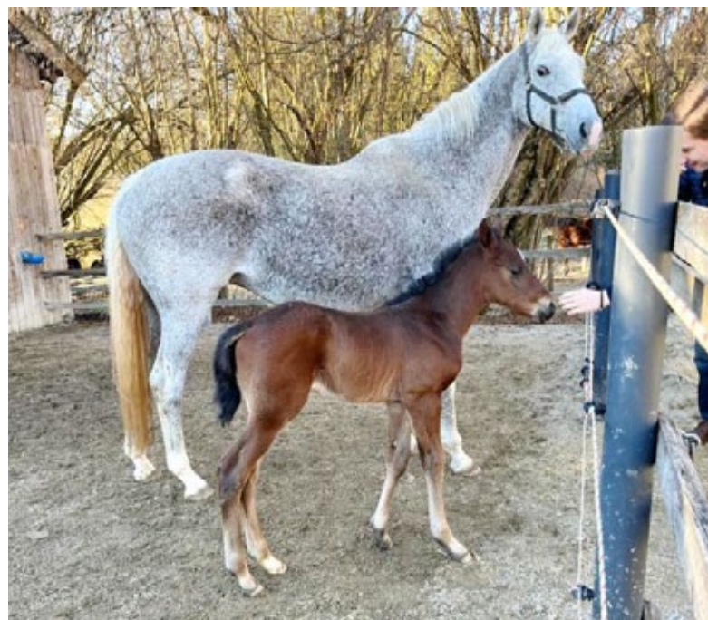
Auch im Gestüt Jettenhausen hat die Fohlensaison begonnen mit diesem Protectionist-Hengstfohlen der Pearl Royale für den Stall Apfelkorn