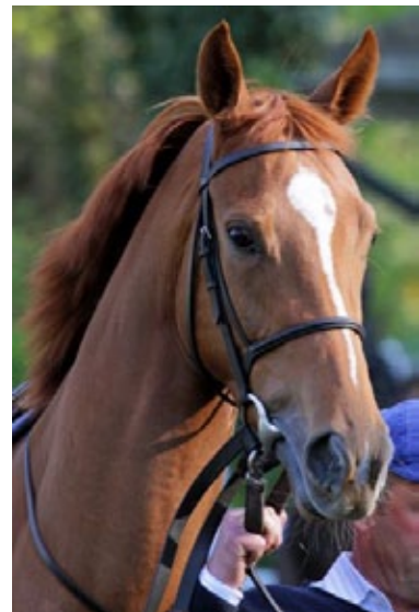
Bravo Girl wurde bei Arqana erworben.

Vergangenen Dezember kam es bei Arqana zum Ankauf von Bravo Girl (Lord of England), 22.000 Euro wurden für sie angelegt. Sie war Dritte im Niederrheinpokal (Gr. III) und auch listenplatziert, hat bereits zwei Sieger auf der Bahn, von denen Bacchilide (Da-