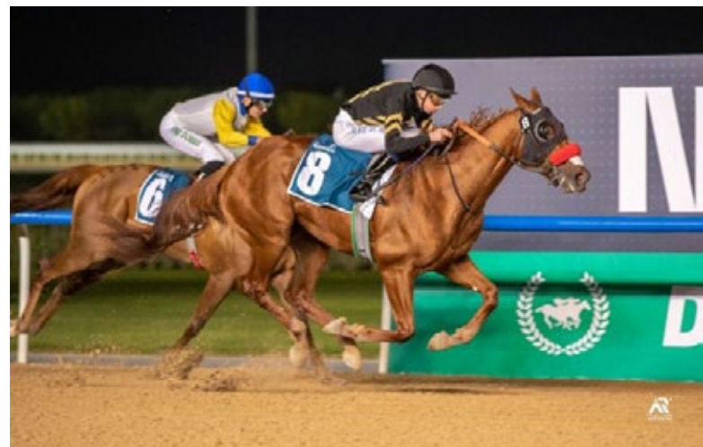
Für Tall Boy war der erste Sieg überhaupt gleich auf Gr.-Ebene erfolgreich.