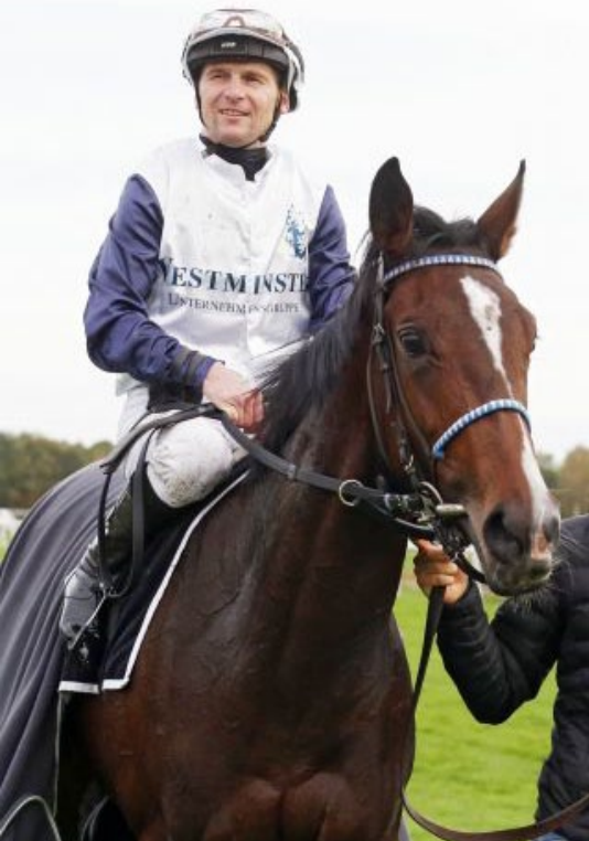
Westminsters Lady Ewelina wurde für den Prix de Diane genannt.

In den sechs wichtigsten Dreijährigen-Rennen Frankreichs sind erstmals mehr Pferde aus dem Ausland als aus den französischen Ställen eingeschrieben worden. Es handelt sich um die Gr. I-Klassiker, die beiden Poules, den Prix du Jockey Club und den Prix de Diane, sowie um den Prix Saint-Alary und den Grand Prix de Paris. Insgesamt gingen für diese Prüfungen