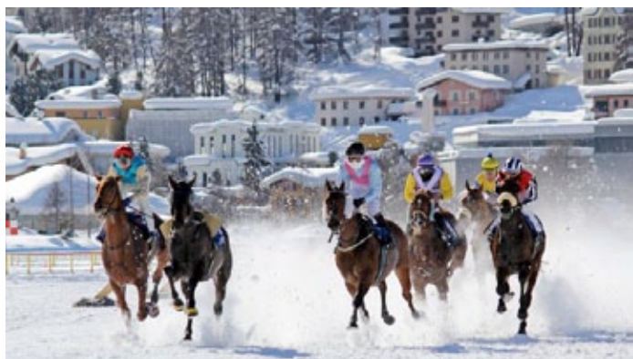
Schneegestöber: Der große Preis von St. Moritz wird am Sonntag mit deutscher Beteiligung ausgetragen.

Dubai Millenium Stakes – Gr. III, 140.000 €, 4 jährige und ältere Pferde, 2000 m