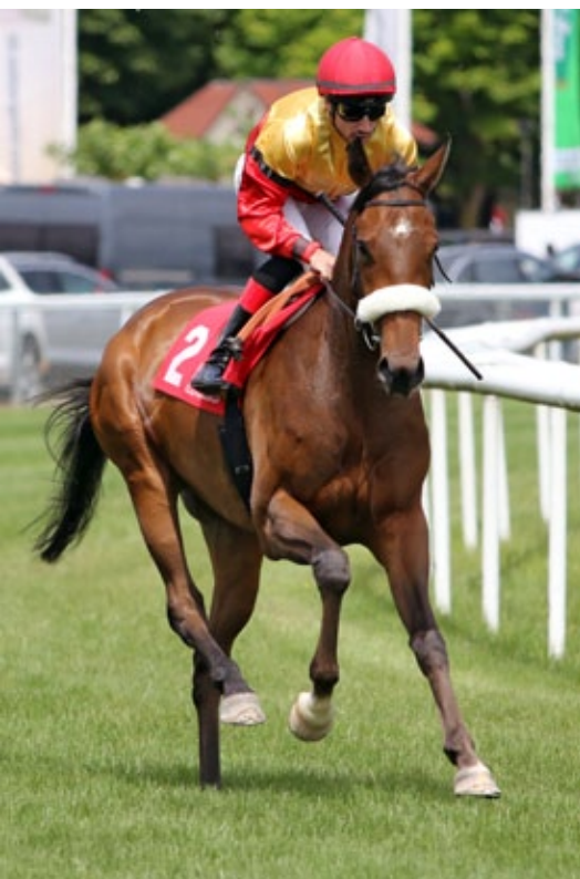
Rondina ist neu eingestellt worden.

birsim) noch im Januar in Chantilly gewonnen hat. Bravo Girl ist Schwester der German 1000 Guineas (Gr. II)-Siegerin Ajaxana (Rock of Gibraltar) aus einer listenplaziert gelaufenen Schwester von Amico Fritz (Fasliyev) und Arlecchina (Mtoto).