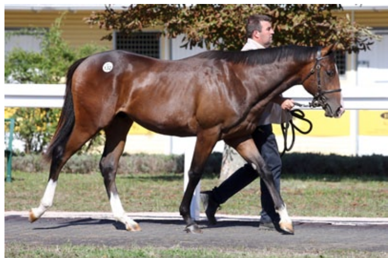
Due Diligence bei der BBAG-Jährlingsauktion.

Dynamique (2019), v. Intello - Dynamica v. Dashing Blade, trgd. v. Amaron