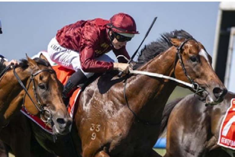
Jacquinet gewinnt die C F Orr Stakes im Zimmer der Rennleitung.