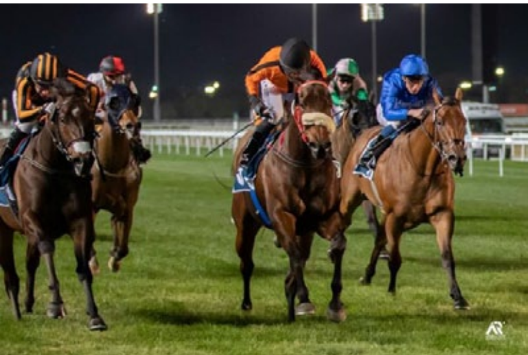
Miqaas (Mitte) kommt im Sprint als großer Außenseiter zum Zuge.

Eine große Überraschung gab es in diesem Sprint, denn mit dem schon betagten Miqaas aus dem Stall des in solchen Rennen eher selten reussierenden Rashed Boursesly konnte niemand rechnen. Es war der erst elfte Start des immerhin schon Achtjährigen, den sein Trainer einst aus dem Shadwell-Kontingent als ungeprüften Dreijährigen für 1.500 Pfund gekauft hatte. In Meydan ist er seitdem nur spärlich gelaufen, allerdings hatte er dort noch am 5. Februar ein Handicap über 1200 Meter gewonnen, war zuvor zu Weihnachten in Sharjah erfolgreich gewesen. Form war in jedem Fall da.