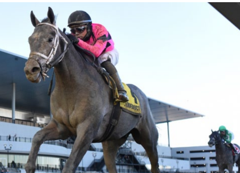
Hit Show holt sich die Withers Stakes.

Zwei Gr. III-Rennen für Dreijährige mit Blickrichtung auf die Klassiker wurden am vergangenen Wochenende in den USA gelaufen. In Aqueduct hätten die mit 250.000 Dollar dotierten Withers Stakes (Gr. III) über 1700 Meter eigentlich am 4. Februar stattfinden sollen, doch wurden sie wegen der extremen Kälte um eine Woche verlegt. Mit Hit Show (Candy Ride) setzte sich unter Manny Franco der klare Favorit durch, er setzte sich gegen Arctic Arrogance (Frosed) und General Banker (Central Banker) durch. Hit Show, im Training bei Brad Cox, stammt aus der Zucht seiner Besitzer, Gary und Mary West. Seine Mutter Actress (Tapit) hat u.a. die Black-Eyed Susan Stakes (Gr. II) gewonnen.