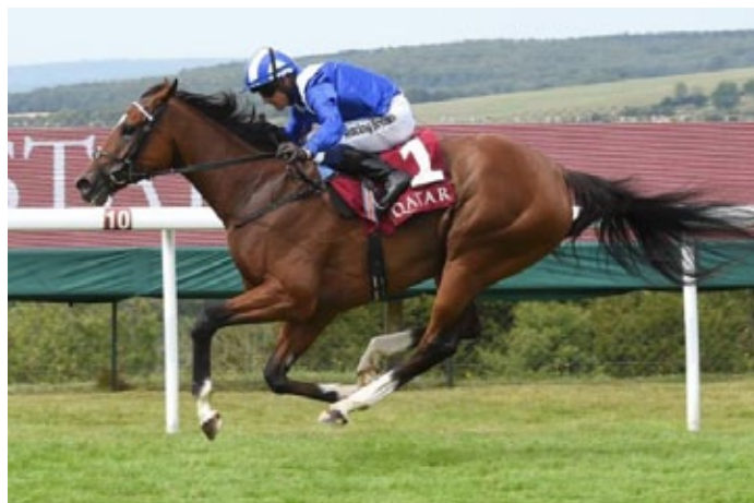
Zweiter Gruppe II-Sieg in Folge für Enbihaar.

Es ist immer so: Kaum hat ein Deckhengst das Zeitliche gesegnet, dann laufen seine Nachkommen besonders schnell. So auch bei Redoute's Choice (Danehill), dem australischen Spitzenhengst, dessen zwei Jahre in Europa eigentlich als enttäuschend abgehakt wurden. Doch jetzt hat er mit Danceteria und Enbihaar zwei