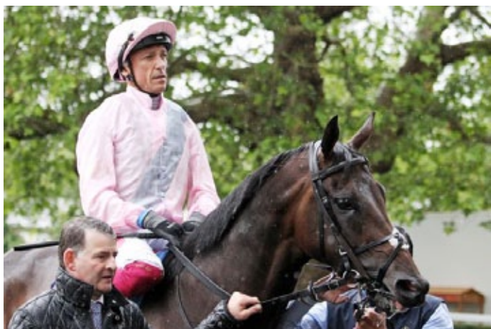
Too Darn Hot im Regen von Royal Ascot.

Nur wenige Tage nach seinem Triumph in den Sussex Stakes (Gr. I) in Goodwood kam die Nachricht aus dem Stall von Trainer John Gosden, dass Too Darn Hot (Dubawi) wegen eines Haarrisses, den er sich im Rennen zugezogen hat, seine Rennkarriere beenden muss. Der Dreijährige ist bereits am rechten Hinterbein operiert worden, hat alles bestens überstanden und wird jetzt auf seine Karriere als Deckhengst im Dalham Hall Stud in Newmarket vorbereitet.