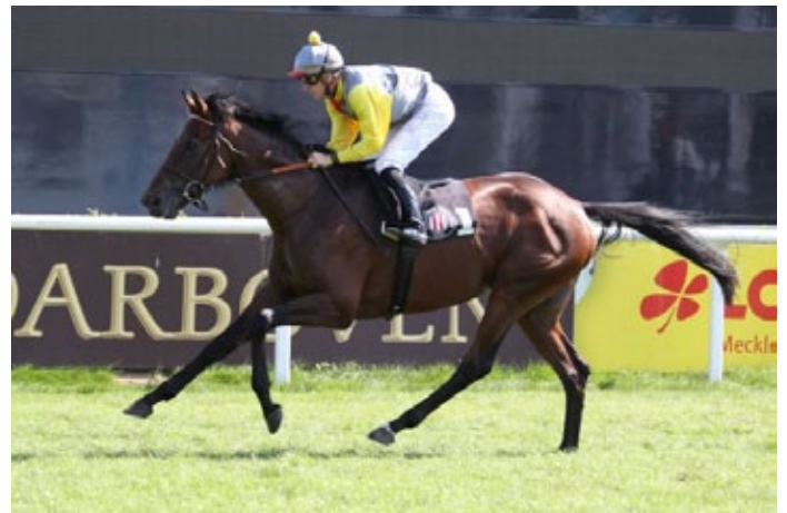
Amazing Star kommt zu einem leichten Favoritensieg.

Erster Sieg beim dritten Start für Amazing Star , der zuvor in Hamburg nur einem späteren Sieger unterlag. Diesmal löste der Schützling von Hans-Jürgen Gröschel eine relativ harmlose Aufgabe. Er ist ein Sohn des mehrfachen Gr.-Siegers Alexandros (Kingmambo), der einige Jahre mit eher übersichtlichem Erfolg im Haras des Logis in Frankreich gedeckt hat. Die Mutter hat bei nur einer Handvoll Starts ein 1800-Meter-Rennen in Hoppegarten gewonnen. Amazing Star ist ihr Erstling, ein Pastorius -Sohn ist im Jährlingsalter. Antonella ist eine Halbschwester von zwei Siegern, die nächste Mutter Alexa (Areion) hat vier Rennen für sich entscheiden können, in Listenrennen in Dresden und Düsseldorf war sie jeweils Dritte. Sie ist Schwester der listenplatziert gelaufenen Artos Dream ( Goofalik ) und Alex ( Local Suitor ).