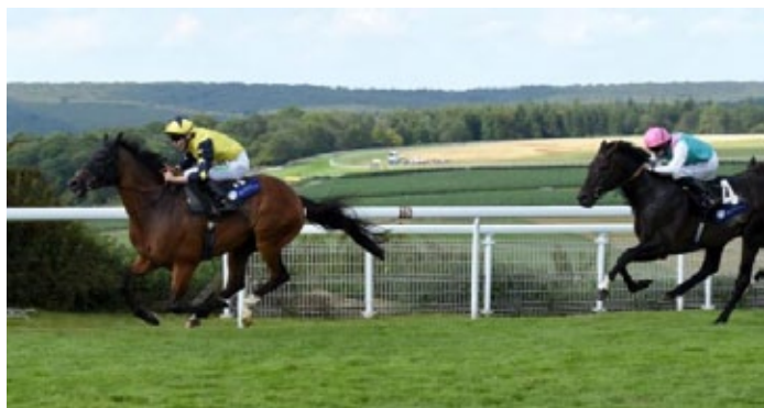
Desert Encounter kommt souverän zu seinem dritten Gr.-Sieg.

Der Halling -Wallach, einst ein 32.000gns.-Jährling, ist Bruder zu zwei Siegern aus einer platziert gelaufenen Schwester des Premio Ribot (Gr. II)-Siegern und Deckhengstes Dane Friendly (Danehill) sowie des Grand Prix de Chantilly (Gr. II)-Siegern Allied Powers (Invincible Spirit). Die nächste Mutter Always Friendly (High Line) war in den Princess Royal Stakes (Gr. III) erfolgreich sowie Zweite im Prix Royal Oak (Gr. I). Desert Encounter hat eine Schwester im Zweijährigenalter von Slade Power und eine Jährlingsschwester von Vadamos .