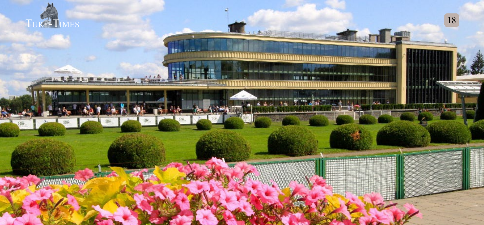
Impressionen aus Warschau.

vorit nur langsam auf die Beine. Einen sicheren Sieg holte sich der von Kishore Mirpuri selbstgezogene dreijährige Noble Eagle (October) mit Anton Turgaev vor dem gleich alten Grants Black (So You Think). Der von Janusz Kozlowski trainierte Sieger stammt aus der alten polnischen Familie der Hulanka (Manton), die nach dem zweiten Weltkrieg vor allem in der Zucht des Gestüts Golejewko große Erfolge feierte.