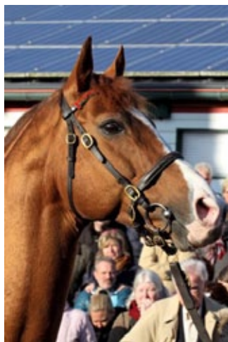
Flamingo Fantasy.

Im Alter von 14 Jahren ist im Gestüt Trona der Deckhengst Flamingo Fantasy (Fantastic Light) an den Folgen einer Kolik eingegangen. Aus der Zucht und im Besitz des Gestüts Park Wiedingen gewann er u.a. den Großen Hansa-Preis (Gr. II) und das Betty Barclay-Rennen (Gr. III), Zweiter war er im Deutschlandpreis (Gr. I). 2014 wurde er im Gestüt von Ralf Paulick aufgestellt, in seinem ersten Jahrgang hat er bei nur wenigen Startern bisher fünf