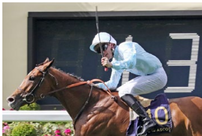
Watch me gewann in Ascot die Coronation Stakes, gelingt ihr in der Heimat der nächste Gr. I-Sieg?