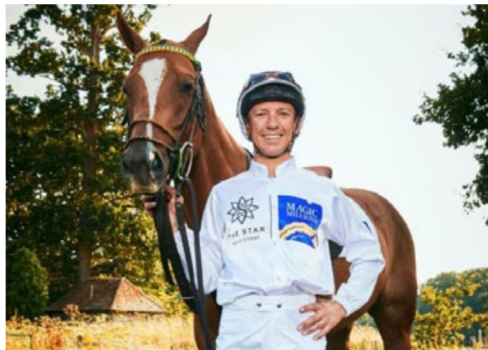
Frankie Dettori schon im Magic Millions-Dress.

Frankie Dettori , 48, wird Anfang kommenden Jahres der Stargast beim Magic Millions Carnival 2020 in Gold Coast/Australien sein. Er wird am 5. Januar als Captain ein Polo Team gegen eine Mannschaft anführen, der auch Kollege Hugh Bowman angehört, zwei Tage später reitet er in einem „Barrier Draw Beach Run“ am Strand. Ernsthafter wird es am 11. Januar zugehen, wenn er am The Star Gold Coast Magic Millions Raceday in den Sattel steigt. Im Umfeld der alljährlichen Jährlingsauktion werden dann mehrere Auktionsrennen mit einer Gesamtdotierung von zehn Millionen A-Dollar (ca. €600.000) gelaufen.