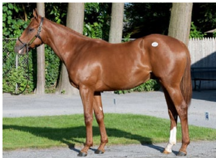
Der Curlin-Sohn aus der Wapi.

Die 99. Saratoga Sale des amerikanischen Auktionshauses Fasig-Tipton endete nach zwei Tagen am Dienstag mit einer neuen Bestmarke, was den Schnitt pro Zuschlag anbetraf. Er lag bei 411.459 Dollar und damit um 11,4 % über dem Wert des Vorjahres. Insgesamt wechselten 135 Jährlinge für 55.547.000 Dollar den Besitzer.