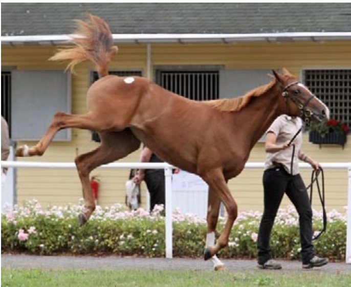
Miss Yoda zeigte ihr Temperament schon bei der Jährlingsauktion.