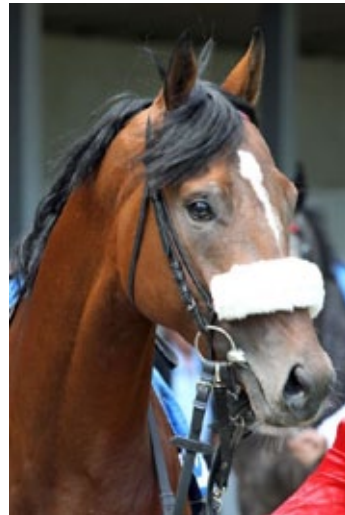
Ashrun.