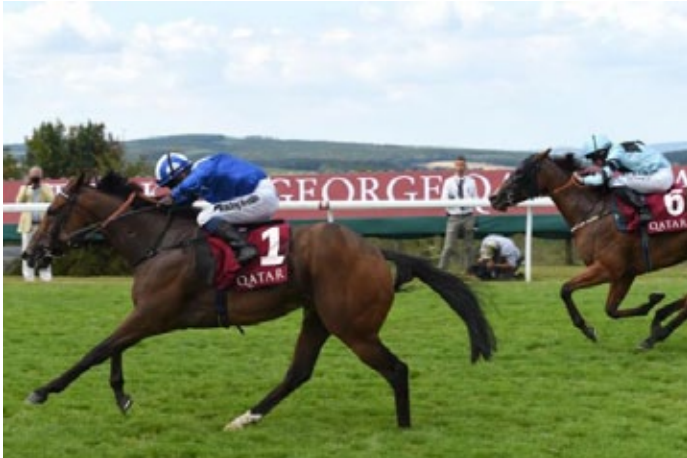
Battaash holt sich zum dritten Mal die King George Stakes.

Er ist und bleibt eine verlässliche Größe über 1000 Meter, insbesondere in Goodwood. Zum dritten Mal in Folge holte sich Battaash die King George Stakes, das war zuvor noch keinem anderen Pferd gelungen, als heißer Favorit war er an den Start gekommen. Seine Welt sind halt diese 1000-Meter-Rennen, erst ein einziges Mal war er über eine längere Distanz unterwegs, gewonnen hat er da nicht. Neun Rennen hat der Wallach, der zweijährig, nach seinem zweiten Start kastriert wurde, bisher auf der Minimaldistanz gewinnen können. Im Frühjahr waren es zum zweiten Mal die Temple Stakes (Gr. II) gewesen, dann war er in den King's Stand Stakes (Gr. I) in Royal Ascot Zweiter zum inzwischen abgetretenen Blue Point (Shamardal). Der ist inzwischen ins Gestüt gewechselt, das bleibt Battaash verwehrt, er dürfte noch die eine oder andere Saison bestreiten. Jetzt