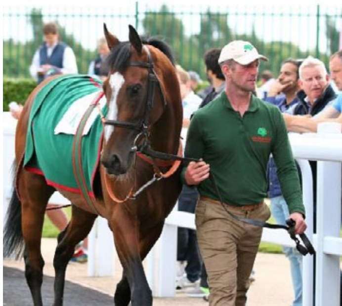
Hasanabad brachte 230.000 Pfund.

Mit einem positiven Ergebnis endete am Mittwoch die eintägige Goffs UK August Sale in Doncaster, wo es bei den Zahlen bessere Resultate als im Vorjahr gab. 216 Pferde wechselten bei einer Verkaufsrate von 85% den Besitzer, der Schnitt pro Zuschlag lag bei 13.413 Pfund, wobei vom Jährling bis zur Mutterstute die gesamte Bandbreite angeboten wurde.