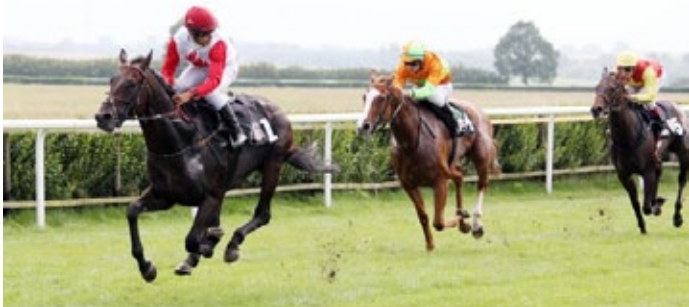
Braveheart kommt als Favorit problemlos zum Erfolg.

Auf doch zu weiten Distanzen war zu Beginn der Saison Braveheart unterwegs, das war vielleicht nicht ganz das Richtige, über 1300 Meter schaffte er jetzt seinen ersten Sieg. Er stammt aus dem ersten Jahrgang des Gruppe I-Siegers Neatico (Medicean), erst vier Nachkommen sind gelaufen, jetzt gab es in Bad Doberan den ersten Sieger. Große Chancen hat der Ittlinger bisher noch nicht so recht bekommen.