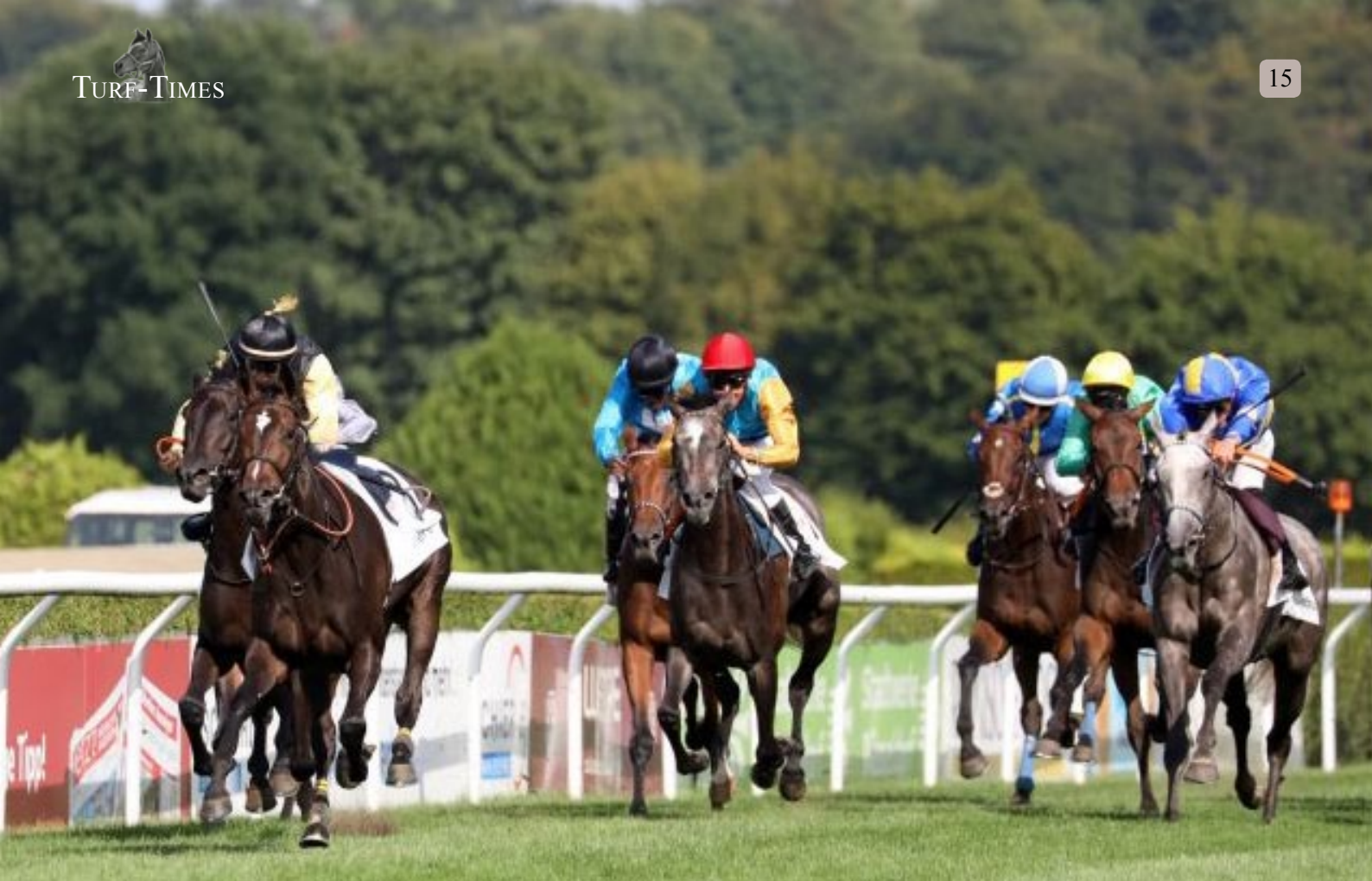
German Oaks: The riderless Ismene is leading, behind her the winner Diamanta .