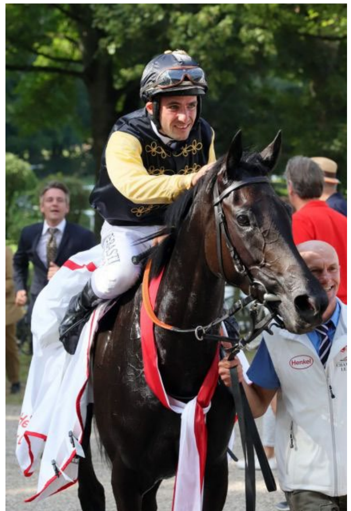
Dia Diana-Siegerin Diamanta unter Maxim Pecheur.

Diamantas Mutter Diamantgöttin ist nur dreimal