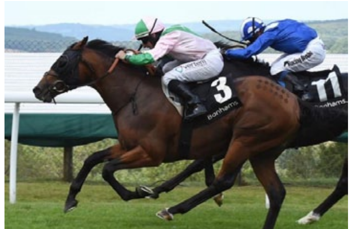
Duke of Hazzard kommt sicher zum Zuge.

Achtmal war Duke of Hazzard zweijährig bereits am Start gewesen, zweimal war er erfolgreich, am Ende des Jahres im Prix Isonomy (LR) in Deauville. In dieser Saison tat er sich in der besten Klasse zunächst nicht leicht. In der Poule d'Essai des Poulains (Gr. I) kam er immerhin auf Rang fünf und nach einem Listensieg Mitte Juli in Newmarket kam er in Goodwood als Favorit an den Start, eine Position, die er bestens ausfüllen konnte. In Newmarket lief er erstmals mit Scheuklappen, das wirkte sich erneut positiv aus.