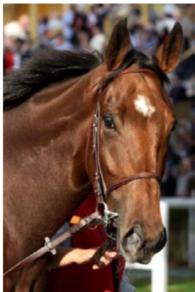
Rock My Love.

Auch bei ihrem zweiten Start in den USA konnte sich Sky Full of Stars (Kendargent) noch nicht besser in Szene setzen. Nach einem fünften Platz vor einigen Wochen in einem Listenrennen wurde die Vierjährige aus Karlshofer Zucht am Sonntag in den Fasig-Tipton Waya Stakes (Gr. III) über 2400 Meter in Saratoga erneut Fünfte, sechs Pferde waren am Start. Joel Rosario ritt die vorjährige Iffezheimer Gr. II-Siegerin, die von