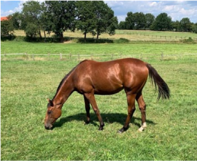
American Desire auf der Koppel in Etzean.