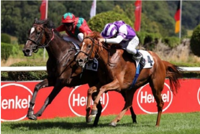
Bahama Girl hält Salve Annetta knapp in Schach.

Eigentlich wirkte Bahama Girl im Führung wie ein Pferd, das den Start noch benötigt hätte, aber am Ende war sie routiniert genug, um den Angriff von Salve Annetta sicher abzuwehren. Gezogen ist sie als Lope de Vega -Enkelin der Borgia (Acatenango) natürlich gut genug. Ihre Mutter Bahama Bay hat dreijährig ein Rennen in Frankreich gewonnen. In der Zucht startete sie mit Bahama Moon (Lope de Vega), der viermal auf der Flachen erfolgreich war, in diesem Jahr über Hürden platziert gelaufen ist. Saroog (Nathaniel) ist dreifacher Sieger, noch in dieser Saison in England. Zweijährig ist Bahama Dream (Dream Ahead), er steht bei Andre Fabre. Eine Jährlingsstute hat Australia als Vater.