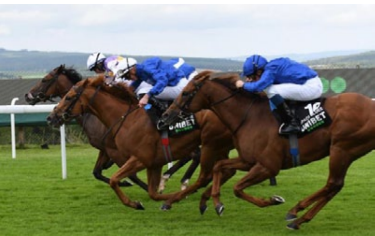
Kinross rettet sich gerade noch ins Ziel.

2. Creative Force (Dubawi), 3. Happy Power (Dark Angel), 4. Space Blues, 5. Escobar, 6. Toro Strike, 7. Fundamental, 8. Safe Voyage • H, K, H, 1 1/4, 5 1/2, 3 1/4 Zeit: 1:31,02 • Boden: schwer