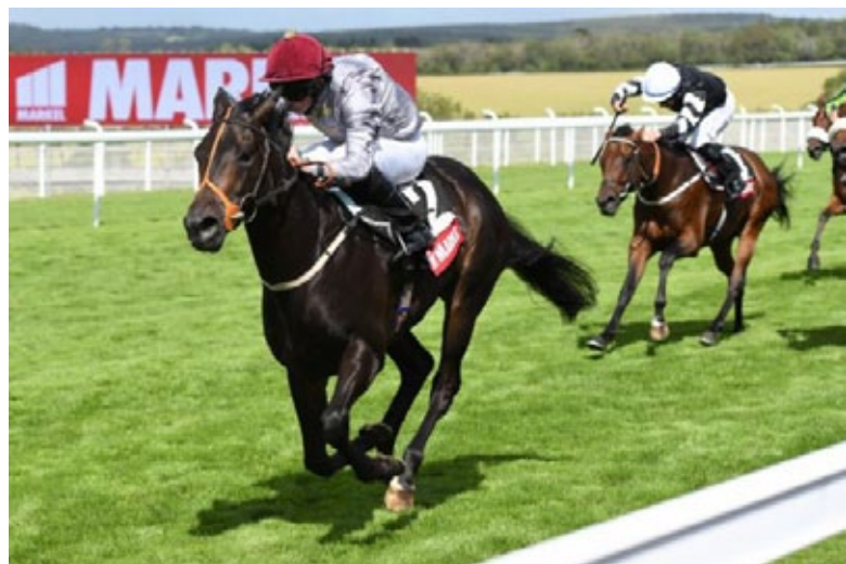
Ein beeindruckender Sieg von Armor in den Molecomb Stakes.