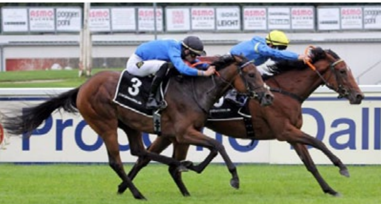
La Estrellita wehrt den Angriff der Favoritin Rosenart knapp ab.

BBAG BBAG-Jährlingsauktion 2020 □ 26.000