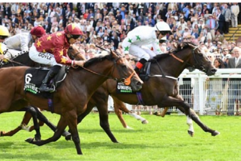
Asymmetric schnappt sich unter Martin Harley die Richmond Stakes.

Schwester der schnellen Fashion Queen (Aqlaam), Listensiegerin und Dritte im Prix du Petit Couvert (Gr. III). Die nächste Mutter Pizarra (Shamardal) ist Schwester der Flying Childers Stakes (Gr. II)- und Molecomb Stakes (Gr. III)-Siegerin Wunders Dream (Averti) und der Ridgwood Pearl Stakes (Gr. III)-Siegerin Grecian Dancer (Dansili), beide sind Black Type-Mütter.