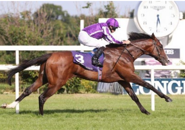
Ein Pferd mit großer Zukunft? Point Lonsdale gewinnt die Tyros Stakes.

2. Maritime Wings (Gleneagles), 3. Unconquerable (Churchill), 4. Chicago Soldier, 5. Gabbys Girl 3, 3 1/2, 1 1/4, 3 • Zeit: 1:29,47 • Boden: gut