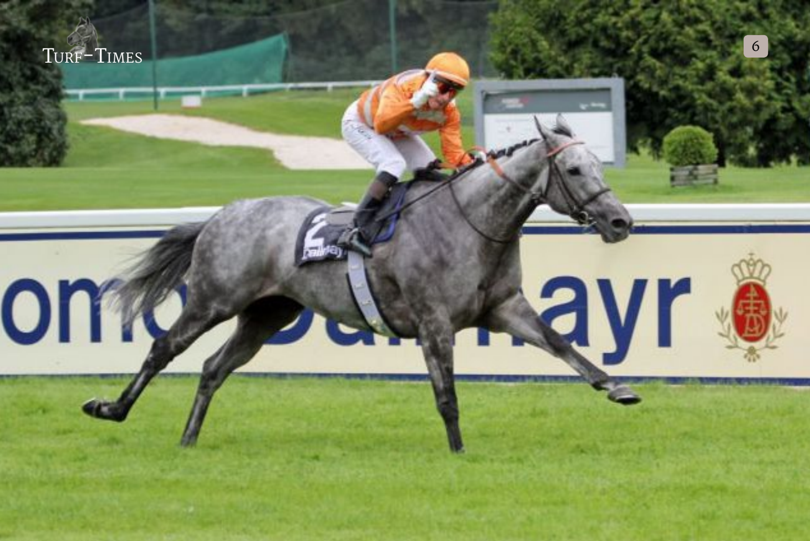
Skalleti gewinnt den Großen Dallmayr-Preis unter Gerald Mosse im Handgalopp.