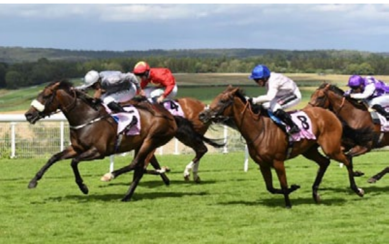
Last Empire holt sich ihren ersten Gruppe-Sieg.