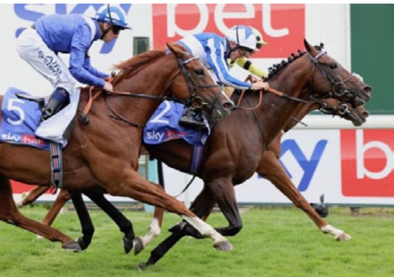
Bangkok kommt knapp zum Erfolg.

2. Juan Elcano (Frankel), 3. Mohaafeth (Frankel), 4. Armory, 5. Monthatham • K, H, 1, 5 1/2 Zeit: 2:16,43 • Boden: gut bis fest