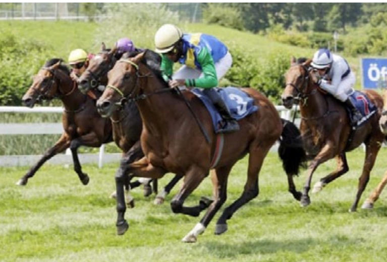
Trotz längerer Pause ist Scipio sofort siegfertig.

Die Pause von 278 Tagen war natürlich das Fragezeichen hinter dem Start von Scipio , der zweijährig bei zwei Starts immerhin beim Debüt Zweiter in einem gut besetzten Dortmunder Maidenrennen war, dann im BBAG-Auktionsrennen chancenlos blieb. Er wirkte in Harzburg noch etwas rund, passte vom Typ her aber auf diese Bahn und gewann am Ende sicher, obwohl ihm unterwegs auch noch ein Hufeisen verlustig ging. Es dürfte für den in Schweizer Besitz stehenden Hengst wohl erst einmal im Handicap weitergehen.