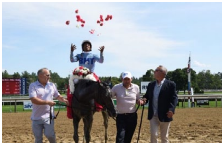
Das Team der Überraschungssiegerin Maracuja.

Mit der makellosen Bilanz von fünf Siegen bei fünf Starts war die Shadwell-Stute Malathaat (Curlin) am Samstag an den Start der mit 465.000 Dollar dotierten American Oaks (Gr. I) in Saratoga gegangen, doch musste sie im nur vierköpfigen Feld eine überraschende Niederlage hinnehmen. Die Siegerin in den Kentucky Oaks (Gr. I), als 30:100-Favoritin am Start, lag im Ziel einen Kopf