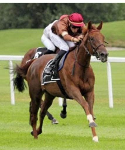
Eine überzeugende Vorstellung von Emmanuelle bei ihrem ersten Rennbahnauftritt.

Es mag nicht die Welt gewesen sein, was hinter Emmanuelle ins Ziel kam, aber der Ton machte die Musik. Die Tai Chi -Stute genoss schon in ihrem früheren Quartier gewisses Ansehen und auch ihre aktuellen Trainingsleistungen sollen nicht verkehrt gewesen sein. Vorerst hat sie keine weiterführenden Nennungen.