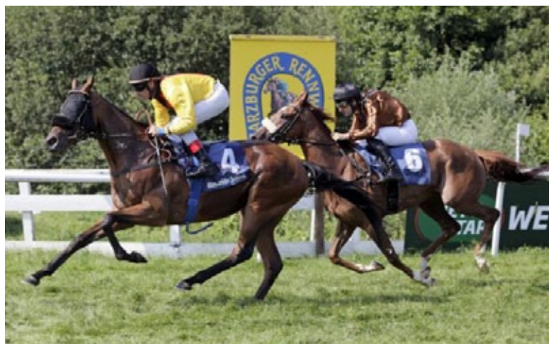
Alira gewinnt als klare Favoritin Start-Ziel.