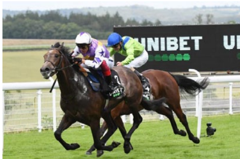
Agent Bleu holt sich unter Frankie Dettori die Vintage Stakes.

120.000 Euro hatte der Dark Angel -Sohn bei Arqana in Deauville gekostet. Die Mutter Cercle de la Vie (Galileo) besaß zwar nur übersichtliches