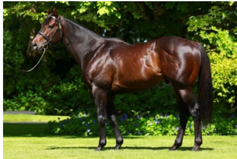
No Nay Never hat innerhalb von fünf Tagen drei Gruppessieger gestellt.

Die Mutter Plying (Hard Spun) lief in den Maketoum-Farben, gewann in Frankreich dreijährig drei Rennen. In der Zucht hatte sie zuvor u.a. Alexander James (Camelot) gebracht, der in Chantilly im Prix Le Fabuleux (LR) erfolgreich war, dazu Dritter im Grand Prix Anjou Bretagne (LR) in Nantes. Eine zweijährige Stute hat Starspang-