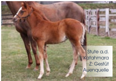
Stute a.d. Katahmar Z: Gestüt Auenquelle

Ausdrucksstarke Fohlen, die durch makellostes Exterieur bestechen – ganz im Typ ihres Vaters und Großvaters