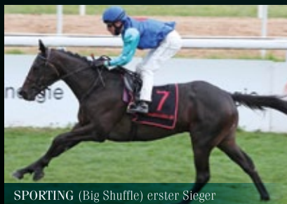
SPORTING (Big Shuffle) erster Sieger