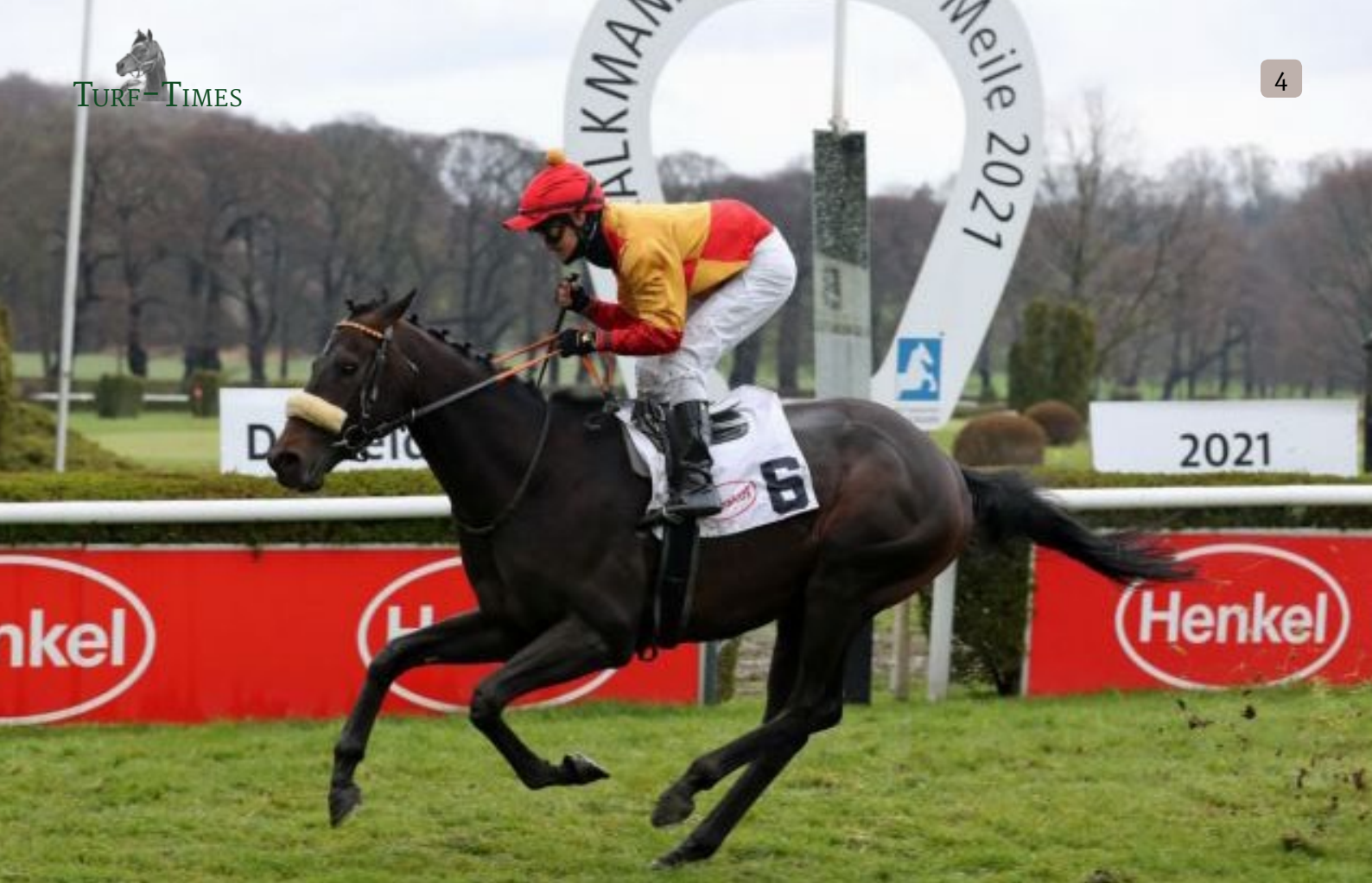
Zavaro kommt unter Rene Piechulek am Ende zu einem sicheren Sieg.