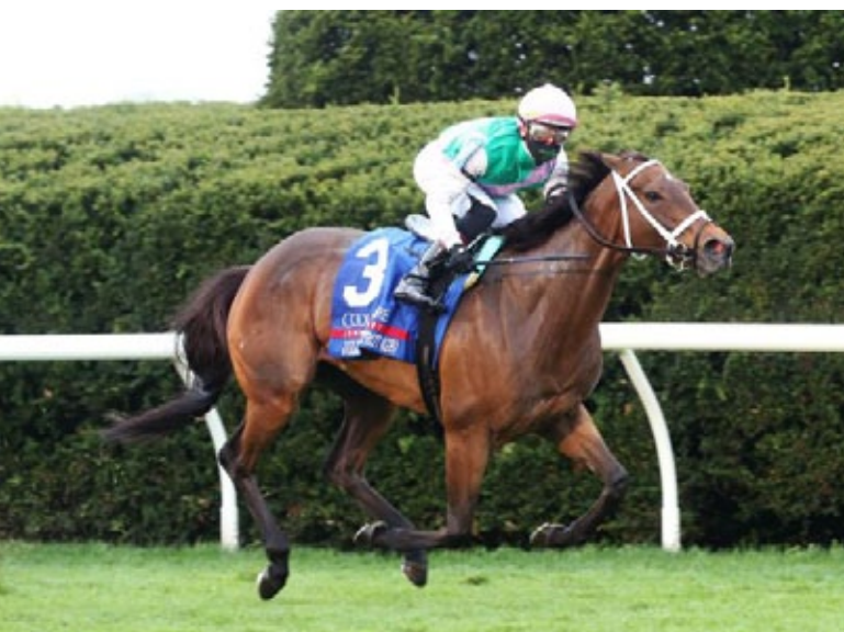
Juliet Fox Trot gewinnt auf Gr. I-Ebene für Juddmonte.