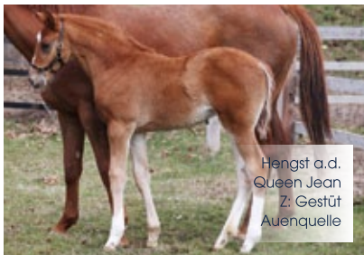
Hengst a.d. Queen Jean Z: Gestüt Auenquelle