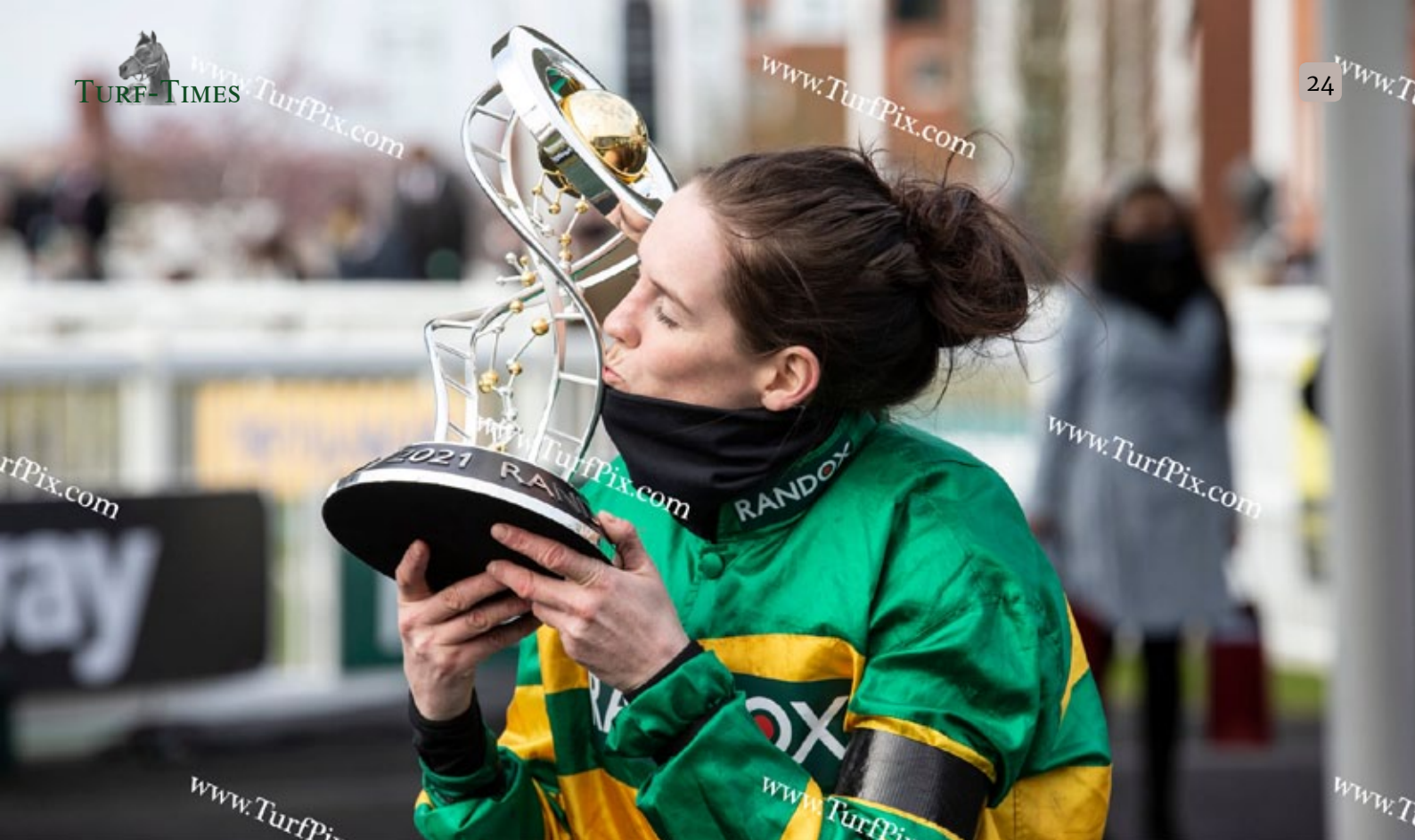
Der Pokal für die Siegerin.

National in einer Saison) ebenso bemerkenswert wie einzigartig ist. Mit seinen acht Siegen hat de Bromhead alleine in England in der laufenden Saison über 1.5 Millionen Pfund an Preisgeld verdient; in Irland nehmen sich seine dort gewonnenen 1.77 Millionen Euro gegen Willie ´ Mullins 3.9 Millionen dagegen eher bescheiden aus.