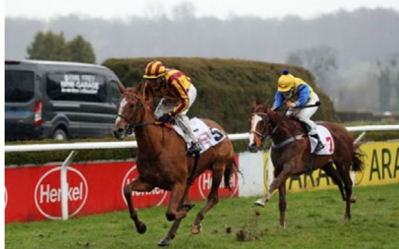
Sevillana gewinnt diesen "Claimer" ohne Probleme, bleibt aber im Stall von Andreas Suborics.

Das Experiment, ein Verkaufsrennen für Dreijährige auszuschreiben, fand zumindest was die Teilnehmerzahl anbetraf, ein gemischtes Echo. Sechs Starter - einer ging nicht in die Box - waren übersichtlich, zudem konzentrierte sich die Gelegenheit auf wenige Trainer. Wobei 5.000 Euro