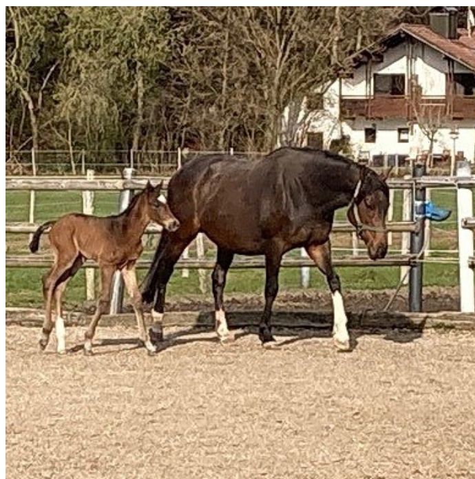
Sehr groß, langbeinig und agil: Das ist die erfreute Beschreibung aus dem Gestüt Jettenhausen zur kleinen Schwester des hoffnungsvollen Sagamore. Mutter Shy Fairy, Vater Brametot und Züchterin Karin Schwerdtfeger werden das gerne hören