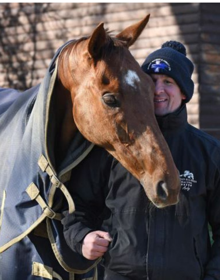
Definitely Red.