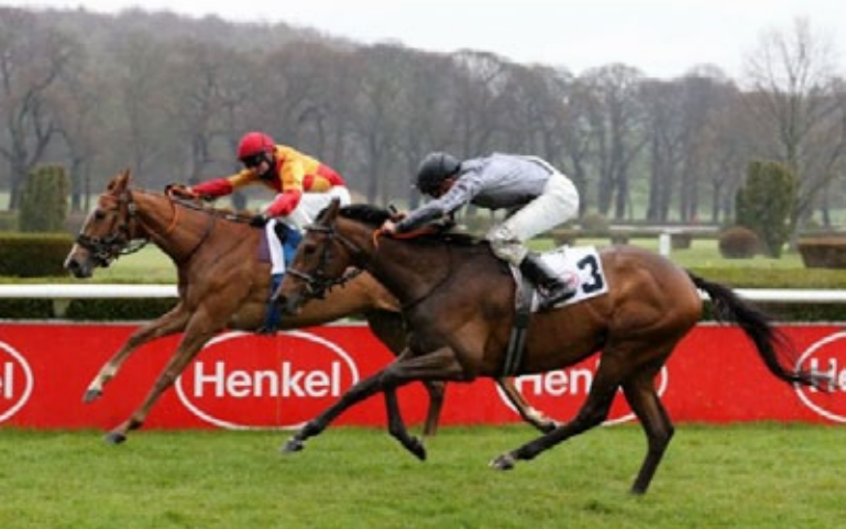
Innen gewinnt: Agentina rettet sich knapp gegen Sconset ins Ziel.