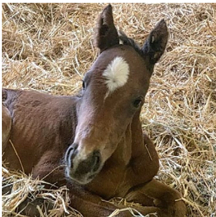
Hallo Welt....: `Wilder Nachwuchs' meldet das Gestüt Brümmerhof zu diesem knuffigen Hengstfohlen der Wild Approach (New Approach). Areion ist der Vater des Jünglings, der sich die Welt aus seinem bequemen Strohnest erst mal in Ruhe anschaut