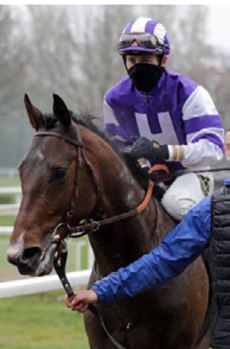
Bei den Buchmachern ist Sun of Gold der aktuelle Derby-Favorit.

1.550 Euro wurden am Montag von den Konten der Besitzer von 74 Pferden abgebucht, die diesen die Startberechtigung für das IDEE 152. Deutsche Derby (Gr. I) – der Namensgeber wurde offiziell erstmals genannt – erhalten haben. Das ist eine Handvoll mehr an Engagements als im vergangenen Jahr und wird vom Hamburger Renn-Club gewiss nicht ungern gesehen, es kommt damit Geld in die Kasse. Doch jetzt ist erstmals einige Wochen Pause mit den Streichungsterminen, denn der nächste und damit auch letzte steht erst am 28. Juni an, sechs Tage vor dem Rennen.