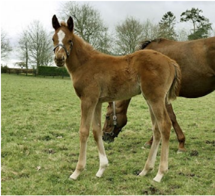
Look at me...: Görlsdorfer Hoffnungen trägt diese brilliant gezogene junge Dame, auf dem Foto aus Irland einen Monat alt. Aus der Zuchtperle Sanwa (Monsun), mit Frankel als Vater und Sea The Moon als Bruder stehen ihr wohl alle Türen offen