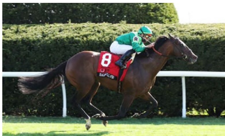
Raging Bull ist souverän.