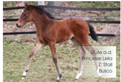
Stute a.d. Princesse Leila Z: Stall Busco

Ausdrucksstarke Fohlen, die durch makellostes Exterieur bestechen – ganz im Typ ihres Vaters und Großvaters