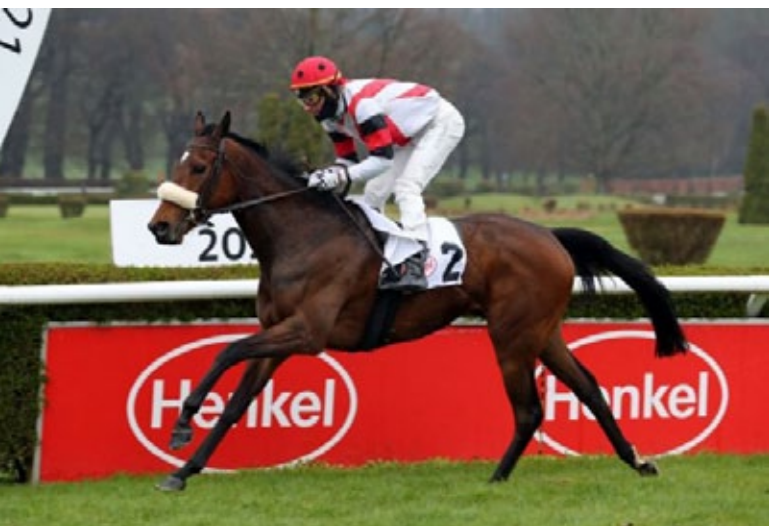
Ein souveräner Sieg von Elegie - das sah nach mehr aus.

gerade eingegangenen Vater werden, der auch die Zweitplatzierte India stellte.