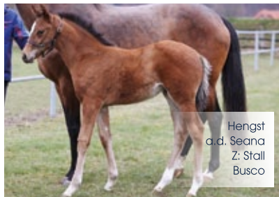
Hengst a.d. Seana Z: Stall Busco