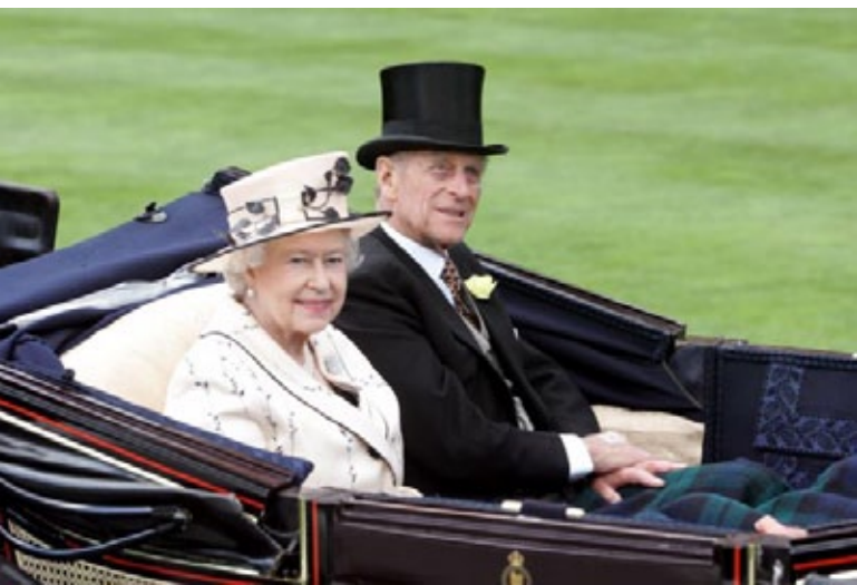
Prinz Philip mit seiner Gattin 2008 in Royal Ascot.

Prinz Philip, der vergangene Woche im Alter von 99 Jahren verstorbene Duke of Edinburgh, wird mit dem Galopprennsport in erster Linie als Gatte der im Turf sehr engagierten Queen Elizabeth verbunden. Regelmäßiger Gast war er während Royal Ascot, wo die Fahrt mit der Kutsche vom Schloß Windsor aus schon Kult war. Er war kurz nach seiner Hochzeit in den Jockey Club gewählt worden und war natürlich das älteste und längste Mitglied. Als Besitzer von Rennpferden trat er nicht in Erscheinung, doch besaß er erstaunlicherweise mit Camira Flash den Sieger des Greyhound Derbys 1968 in White City. 40.000 Zuschauer waren damals im Stadion, der Besitzer des Hundes war auch vor oft. Den Siegpriestiftete er damals wohlthätigen Zwecken.