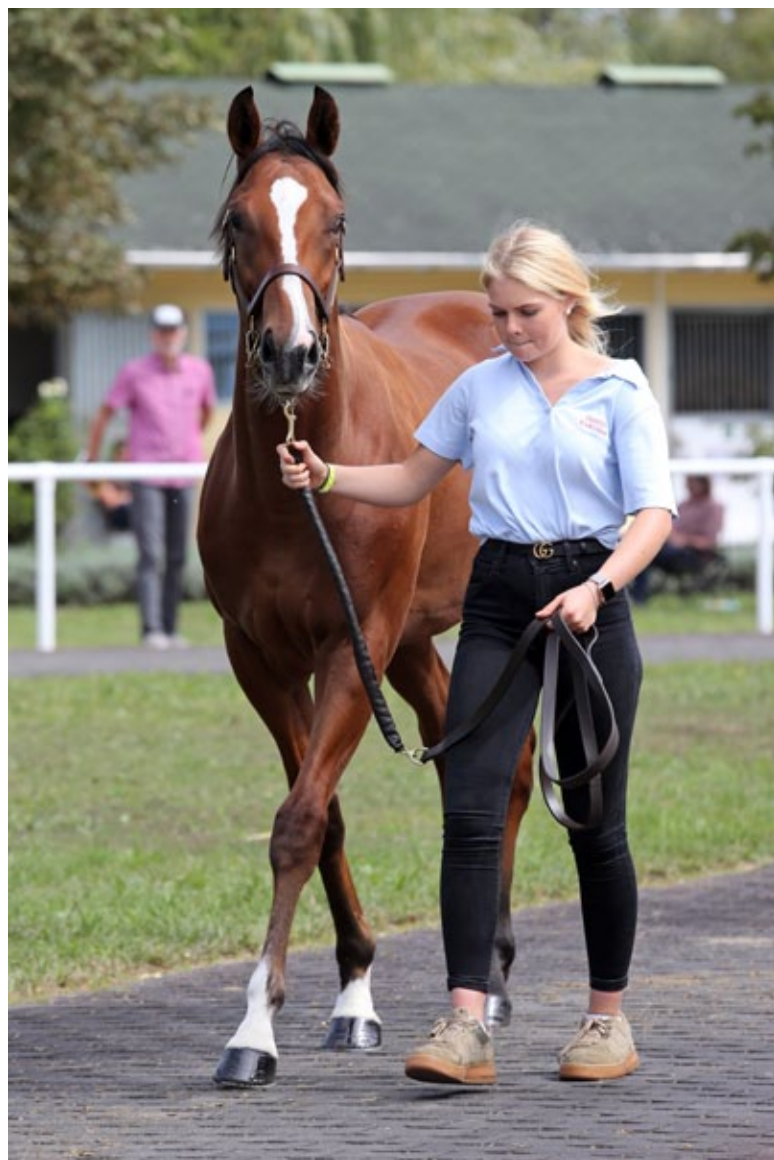
Der Counterattack-Sohn Zandjan bei der BBAG-Jährlingsauktion.

Wittekindshofer Tiger Hill-Linie. Die nicht gelaufene Top Model ist eine Schwester von Tai Chi (High Chaparral) und Taraja (High Chaparral). Ihr Erstling Taher (Isafahan) steht für Darius Racing bei Henk Grewe, eine Jährlingsstute hat Counterattack als Vater. Zerawiyna, die zweijährig aus dem Bestand des Aga Khan nach Deutschland kam, hat als Erstling Zahedan (Isfahan) gebracht, den Markus Klug für Darius Racing trainiert. Es handelt sich um die Linie der großen Zarkava (Zamindar).