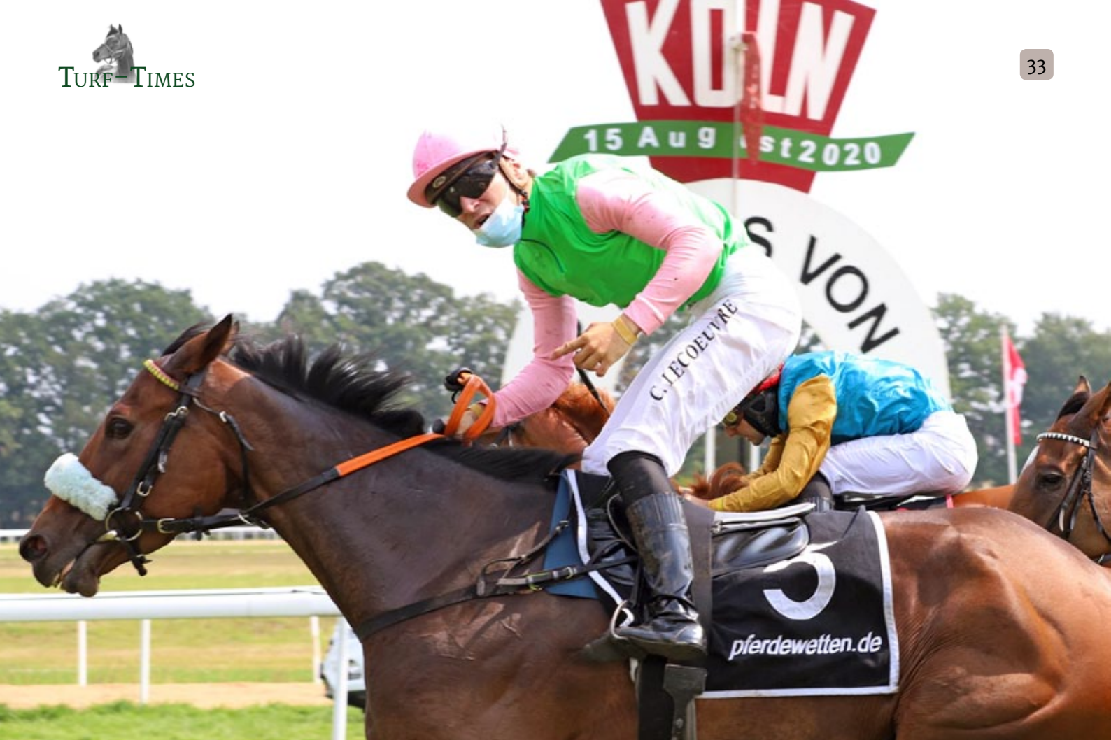
Gr. I-Sieg für die Karlshofer Zucht: Donjah gewinnt den Preis von Europa.