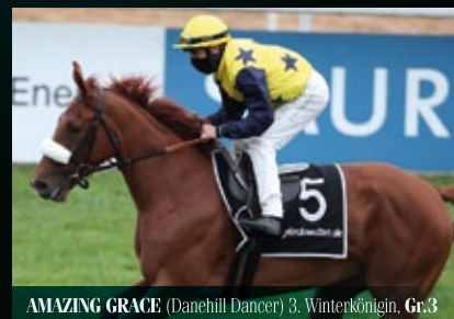
AMAZING GRACE (Danehill Dancer) 3. Winterkönigin, Gr.3