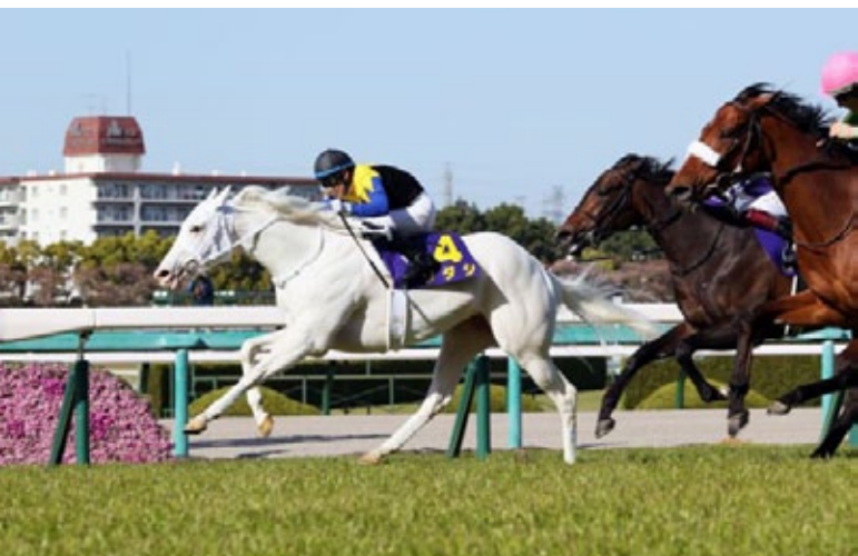
Sodashi bei ihrem klassischen Sieg in Hanshin.