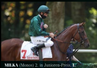
MILKA (Monos) 2. in Junioren-Preis, L.