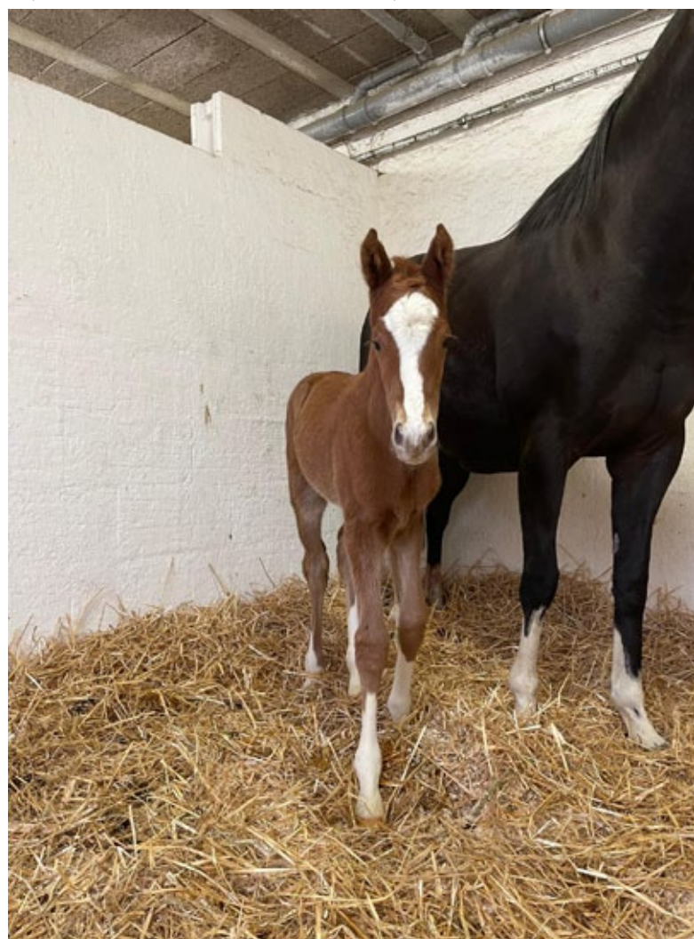
Die rechte Schwester von Isfahani: Stutfohlen von Isfahan aus der Identity.

Top Model (2013), v. Teofilo – Taita v. Big Shuffle, Stutfohlen v. Counterattack, 6.4.