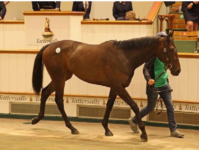
Diese Practical Joke-Tochter geht wieder in die USA zurück.

Prognosen waren vor der ersten Breeze Up-Auktion des Jahres in Europa nur schwer zu erstellen: Die Tattersalls Craven Sale am Dienstag und Mittwoch im englischen Newmarket sind doch eher eine „Boutique“-Versteigerung, wobei man sich stets auf unsicherem Terrain bewegt. Am Ende konnte jedoch ein positives Fazit gezogen werden. Von den 137 angebotenen Zweijährigen wurden 121 für 10,4 Millionen gns. verkauft, der Schnitt pro Zuschlag lag bei 86.201gns.