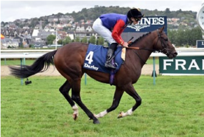
Tactical, hier letztes Jahr in Deauville.