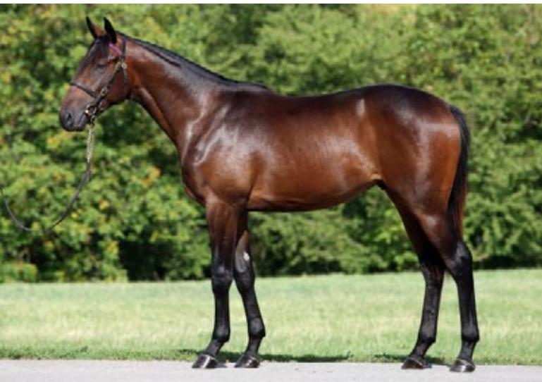
Brilliant Star als Jährling in Westerberg – am Sonntag läuft er in Most.

Der Druck, der auf Trainer und Ställe mit klassischen Hoffnungen gerichtet ist, ist jeden Frühling enorm hoch. Es gilt keine Zeit zu verlieren und eine gute Marschroute zu wählen, vor allem in Hinsicht auf das Derby. In Tschechien ist es nicht anders, am Anfang der zweiten Coronasaison scheint aber die Eile, in der die Top-Dreijährigen in den klassischen Trials die genügende Handicap-Marke ergattern müssen, noch größer als sonst zu sein. Denn im Gegensatz zum letzten Jahr, in dem das Prager Derby auf den ersten September-Sonntag verschoben wurde, behält es diesmal den traditionellen Termin Ende Juni. Und da die Saison erst an diesem Sonntag in Most beginnt, können sich vor allem dreijährige Debütanten mit klassischen Ambitionen kaum Fehler leisten.