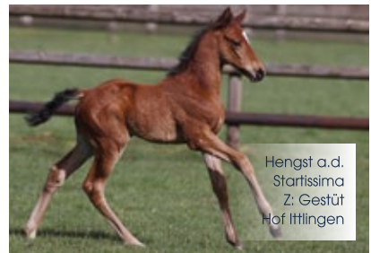
Hengst a.d. Startissima Z: Gestüt Hof Ittlingen