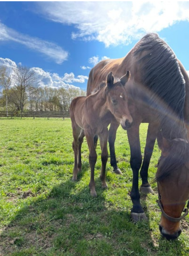
Days of Thunder mit ihrem Stutfohlen von Counterattack.

hat wieder Mastercraftsman zum Vater. Aus dieser Familie kommt auch die Gr. III-Dritte Alkhana (Dalakhani), die in der Zucht bisher nicht viel Glück hatte.