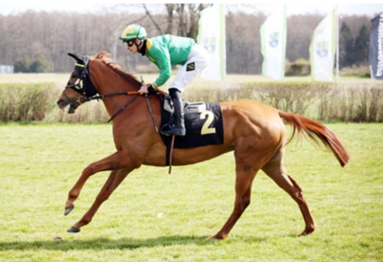
No Limit Credit, hier bereits in den Sartori-Farben in Hoppegarten. www.galoppfoto.de

Let's Dance (2012), v. Samum – Lazeyma v. Fantastic Light, Stutfohlen v. Golden Horn, 29.3.