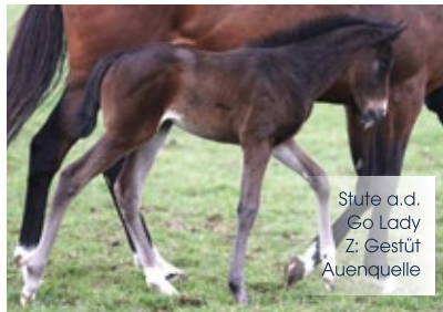
Stute a.d. Go Lady Z: Gestüt Auenquelle