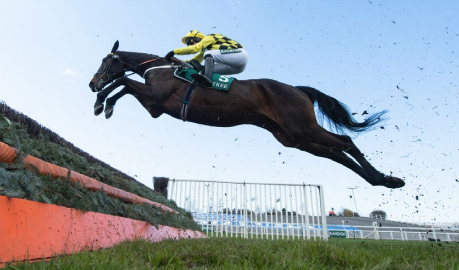
Shishkin kam einmal mehr zu einem souveränen Erfolg.