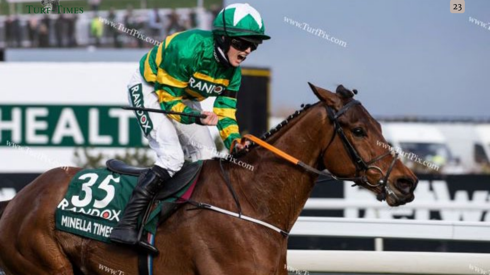
Im Ziel des Grand Nationals 2021: Minella Times und Rachael Blackmore.