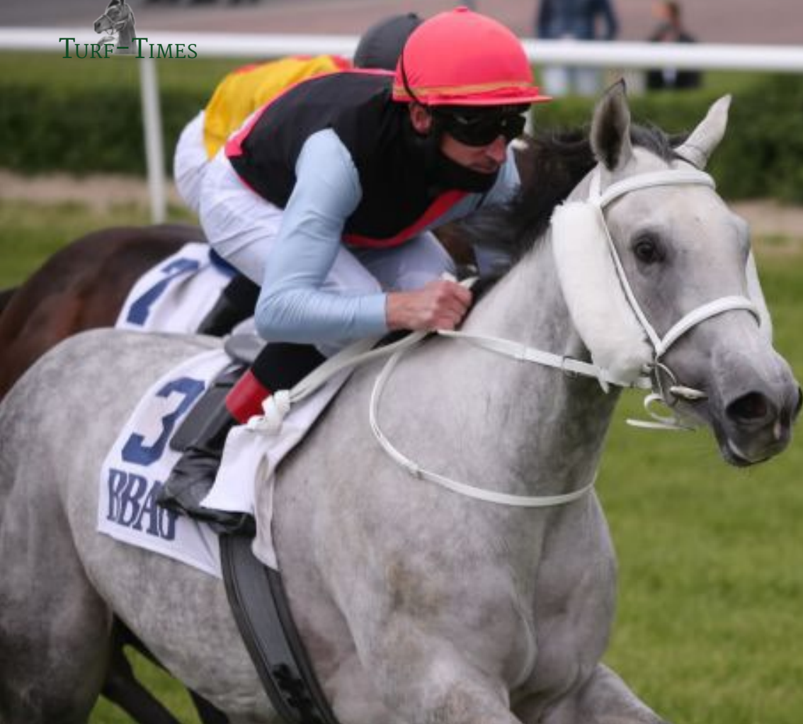
La La Land bei ihrem Sieg im BBAG-Auktionsrennen in Dresden.

Im zweiten Jahr steht der Epsom Derby (Gr. I)-Sieger Masar im Dalham Hall Stud. Der mit einem erstklassigen Pedigree ausgestattete Hengst wurde bereits von mehreren deutschen Züchtern gebucht. Karlshof schickt ihm La La Land , die in der Spitze ein Rating von 89kg hatte, das BBAG Auktionsrennen in Dresden gewann und zweimal Dritte auf Listenebene war.