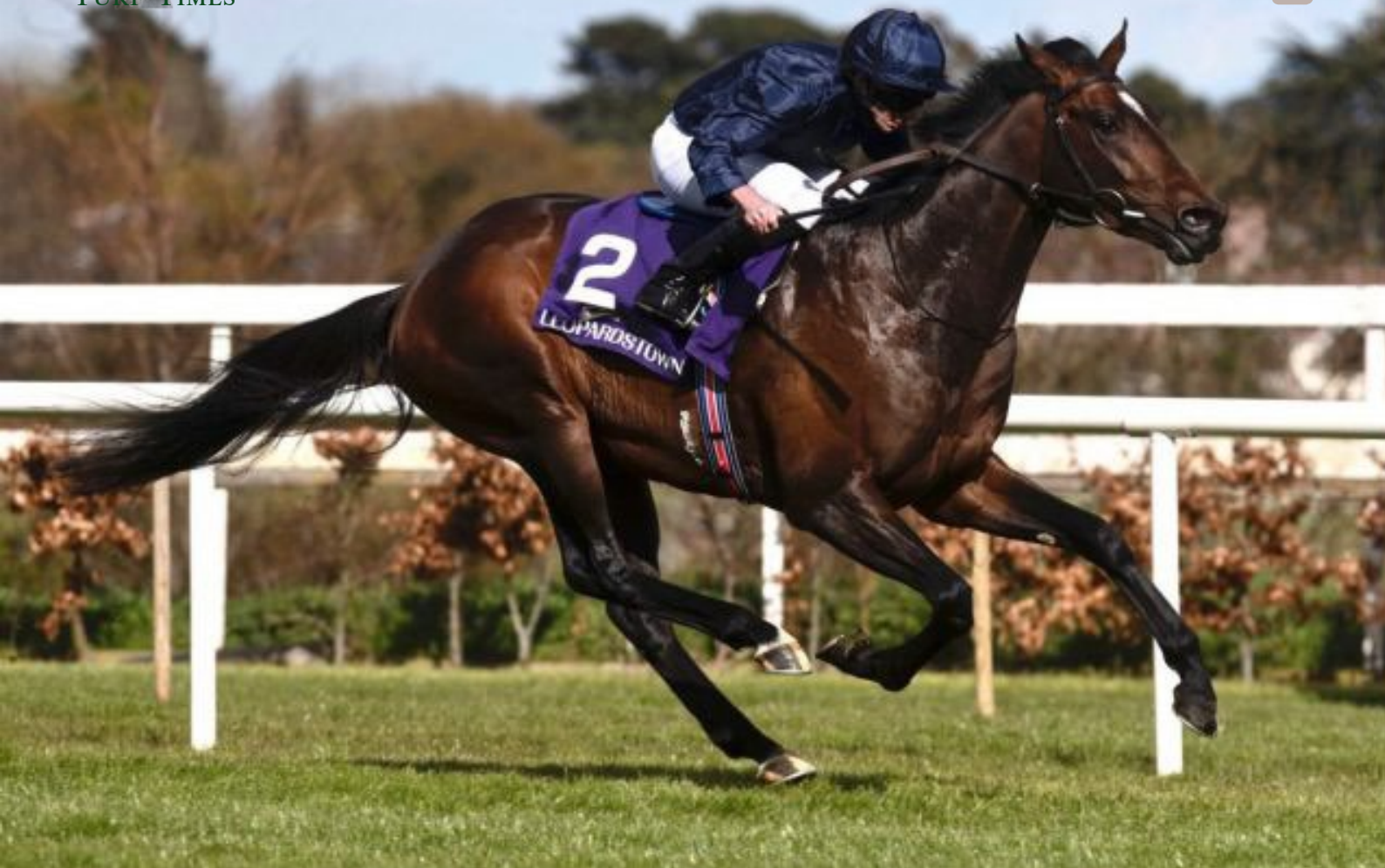
Bolshoi Ballet ist ein Ballydoyle-Hengst mit Derby-Ambitionen.