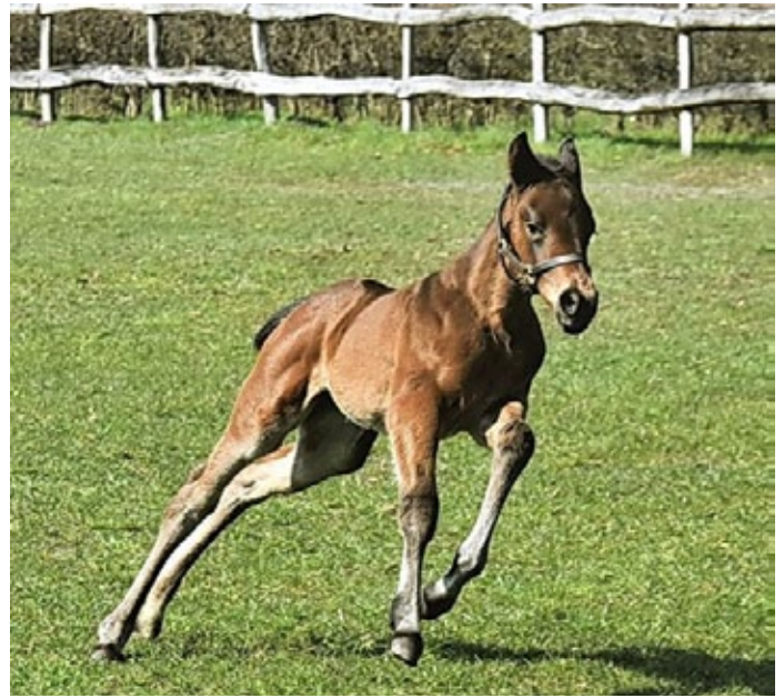
Schräglage: Beim Training ihrer Kurventechnik auf Görlsdorfer Koppeln sieht man hier die an Ostern geborene Sea The Moon-Tochter der Equity Card, der Schwester der gruppenplatzierten Snow. Das sieht doch schon richtig gekonnt aus!