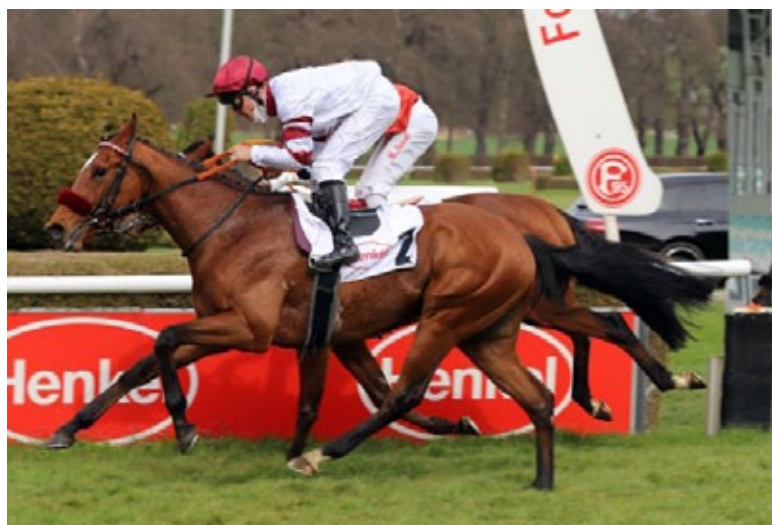
Juanito tritt am Sonntag im Prix Fontainebleau an.