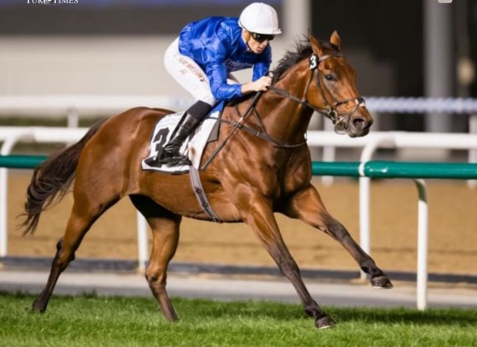
Dream Castle ist erneut ein souveräner Sieger.