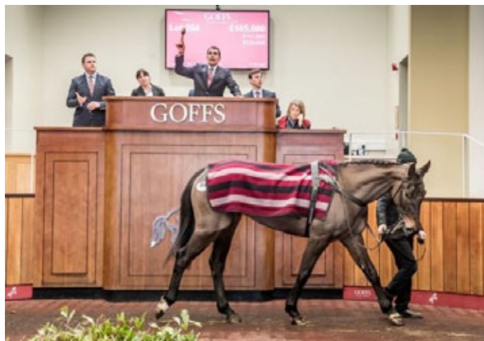
Der Salestopper in Doncaster.