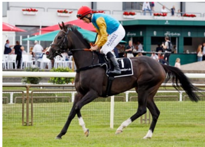
Attica gehört zu den Neueinstellungen 2019.

Die „U“-Familie betrat erstmals 1926 mit Unschuld (Wool Winder) Röttgener Boden. Aus ihr stammt mit Uomo (Orator) immerhin der Derbysieger von