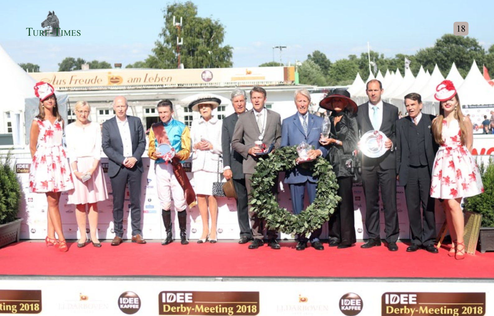
Ganz Röttgen auf dem Siegerpodium nach dem Derbysieg von Weltstar.