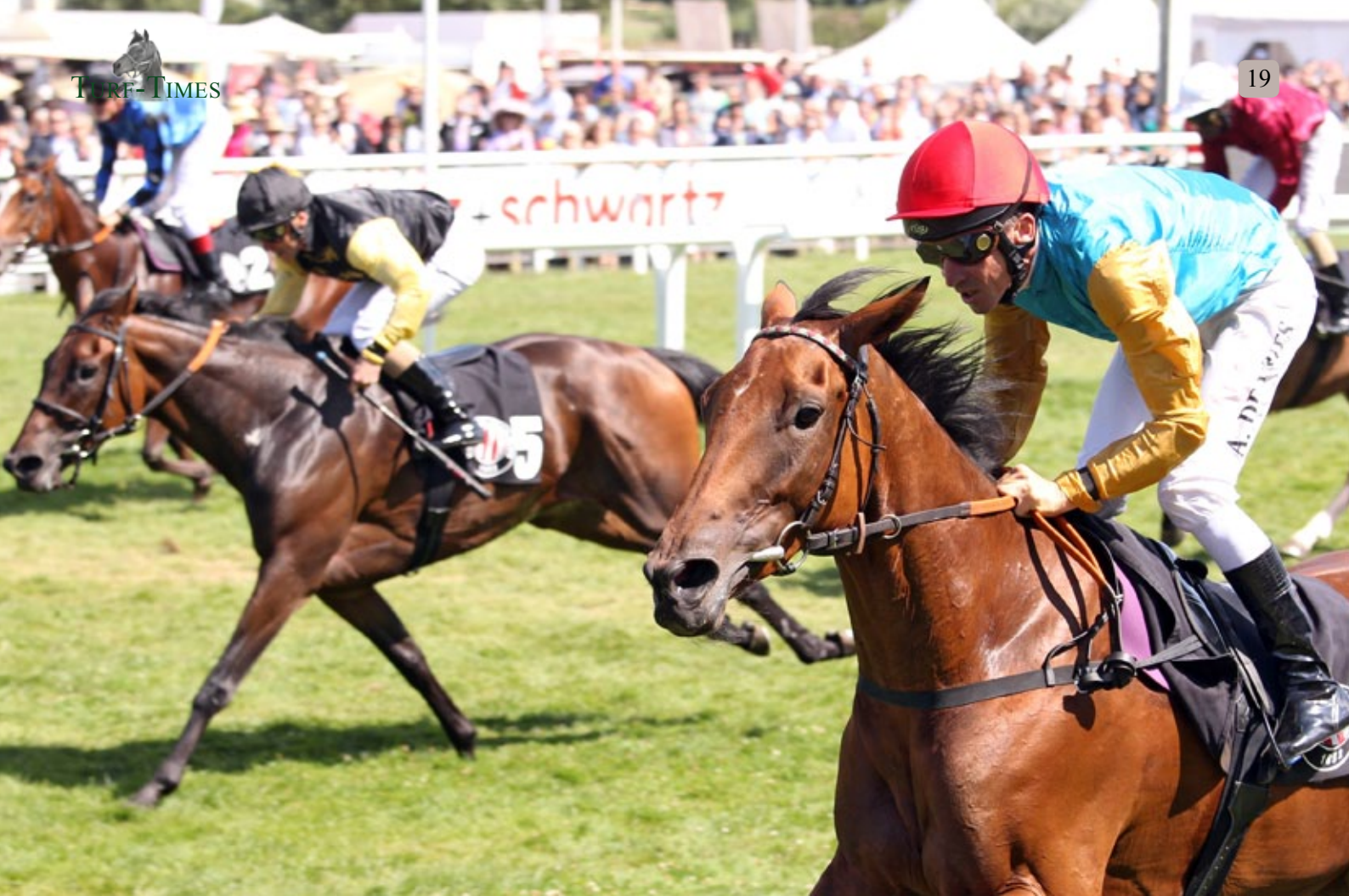
Alicante (vorne) gewinnt auf Listenebene in Hamburg.

mehr wissen. Röttgen selbst unterstützt ihn selbstverständlich, in diesem Frühjahr mit sechs Stuten. Reliable Man steht jetzt im zweiten Jahr in Frankreich, wo der Zuspruch zumindest 2018 sehr gut war, er hat deutlich mehr als einhundert Stuten gedeckt. Röttgen ist unverändert ein wichtiger Anteilseigner, deshalb machen sich auch sechs Stuten auf dem Weg in die Normandie.