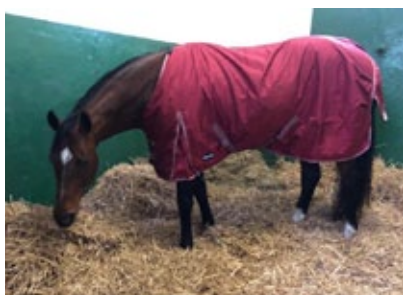
Red Jazz ist schon in Röttgen eingetroffen.

Der erste Teilnehmer an der Deckhengstparade am Samstag im Rahmen des Züchertreffs des Gestüts Röttgen traf schon am Donnerstag ein: Red Jazz, neuer Hengst im Gestüt Lindenhof, war aus Irland über das eng-