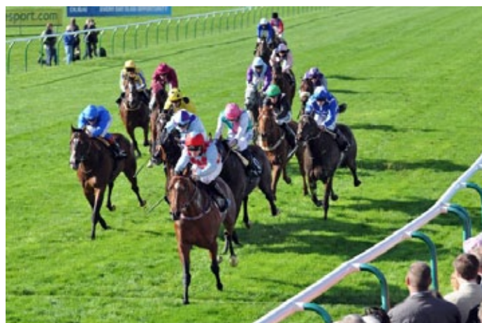
Red Jazz bei seinem Sieg in den Challenge Stakes (Gr. II) in Newmarket.

2014 wurde er im Ballyhane Stud von Joe Foley in Irland aufgestellt, sein erster Jahrgang ist also gerade vierjährig geworden. An Siegern hat es bisher nicht gemangelt, in bisher jeder Saison im zweistelligen Bereich und mit Snazzy Jazzy hat er vergangenes Jahr auch einen Gruppe-Sieger gestellt. Der Hengst aus seinem ersten Jahrgang hat im Oktober den Prix de Seine-et-Oise (Gr. III) gewonnen, zudem zweijährig ein hoch dotiertes Auktionsrennen auf dem Curragh. Zuverlässig gewinnen Nachkommen von Red Jazz in ganz Europa, es werden sicher noch mehr. Anzumerken ist auch, dass