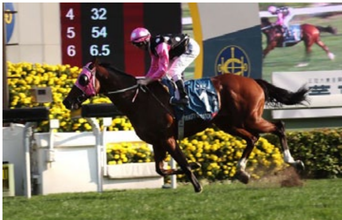
Beauty Generation ist einsam voraus.

Der beste Meiler der Welt gab sich am Sonntag in Sha Tin keine Blöße: Beauty Generation (Road to Rock) gewann zur Minimalquote von 1/10 den Steward's Cup (Gr. I) über 1600 Meter in der bemerkenswerten Zeit von 1:33,51 Minuten. Unter Zac Purton setzte sich der im September 2012 in Neuseeland gezogene Wallach gegen Conte (Starcraft), einen Aufsteiger der letzten Wochen, sowie Southern Legend (Not A Single Doubt) durch. Im sechsköpfigen Feld belegte der vom Gestüt Wittekindshof gezogene Pakistan Star (Shamardal) Rang vier. Sein Reiter Silvestre de Sousa meinte danach, dass die Distanz für ihn zu kurz gewesen sei.