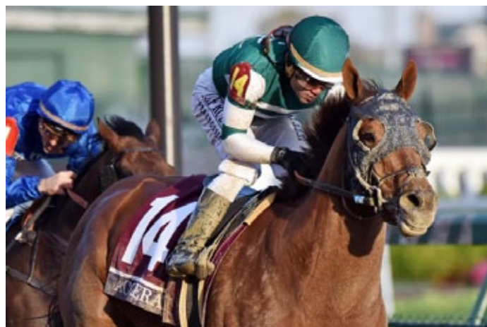
Der Breeders' Cup-Sieger Accelerate ist der haushohe Favorit für den Pegasus World Cup.