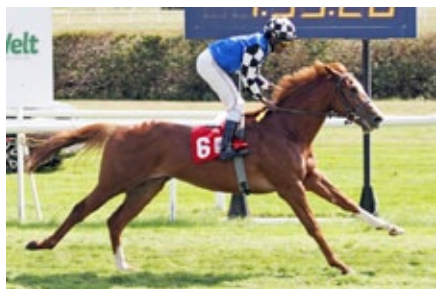
Revelstoke steht im Katalog der Arqana-Auktion im Februar.

Zwei alles andere als uninteressante Pferde aus dem Stall von Trainer Andreas Wöhler kommen bei der Februar-Auktion von Arqana am 12. und 13. Februar in Deauville in den Ring. Wild