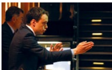
BUILDING ON EXPERIENCE