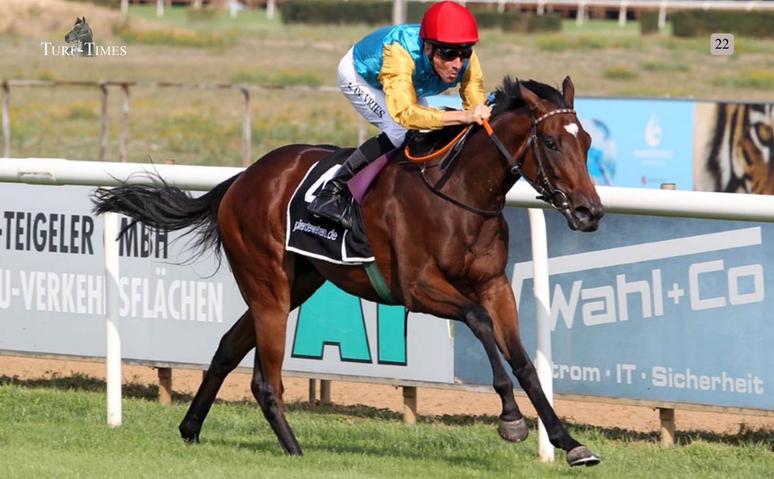
Sharoka, eine Hoffnung für die klassischen Rennen. www.galoppfoto.de

Die Listensiegerin und Diana Trial (Gr. II)-Vierte Weichsel bekommt mit Exceed and Excel einen prominenten Darley-Hengst als Partner. Ihr Erstling ist die Zweijährige Weitsicht (Sea The Moon). Well American kam über den Umweg USA nach Röttgen. Ihr siebentes Fohlen war ihr bisher bestes, es war Well Spoken (Soldier Hollow), Siegerin im Preis der Winterkönigin (Gr. III). Es gibt aber noch viele junge Nachkommen, von Campanologist, Reliable Man und Soldier Hollow. Sie bleibt bei Millowitsch. Für Well Spoken geht es in ihrem zweiten Gestütsjahr zu Golden Horn.