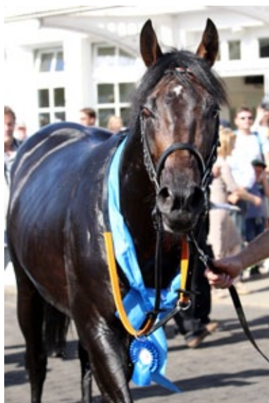
Der Derbysieger Weltstar.