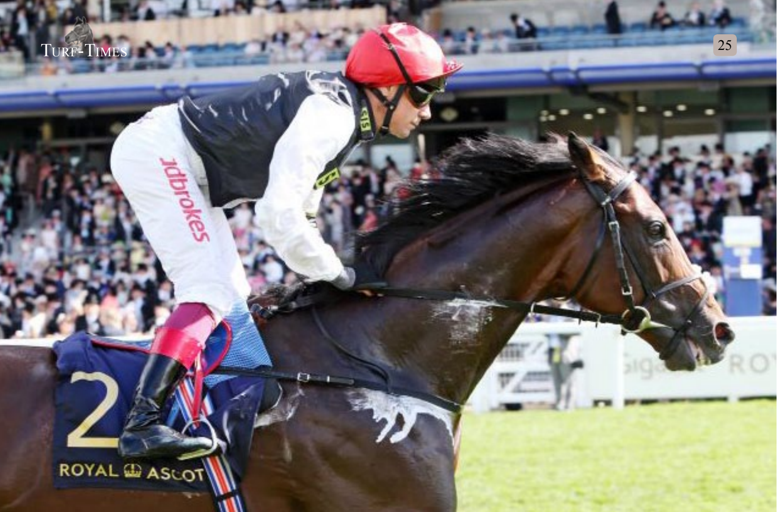
2018 das beste Pferd der Welt? Cracksman unter Frankie Dettori.