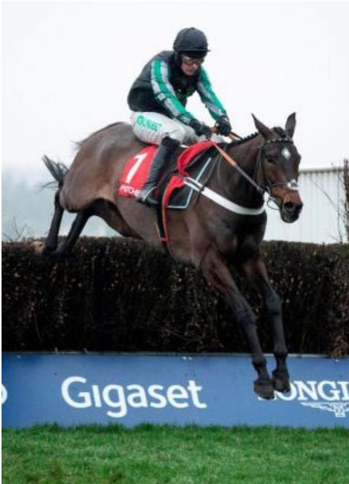
Altior ist einmal mehr ohne Konkurrenz.

Turbulente Zeiten auf der Insel, da ist es gut zu wissen, dass auf ein Pferd immer Verlass ist. Die Rede ist natürlich von Altior, der am vergangenen Wochenende in Ascots Clarence House Chase (Gr.1, 2m1f) sein 17tes (in Worten: siebzehntes!) Rennen in Folge gewann. Es war das (bisher) achte Gr. 1-Rennen seiner Karriere, die im Mai 2014 begann; seit der nun 9j. Wallach im Oktober 2015 erstmals über Hürden antrat, ist er – egal ob kleine Hürden oder die großen Jagdsprünge – ungeschlagen. Mehr noch, bis auf zwei knappe Einläufe zu Beginn seiner Laufbahn ist Altior nicht nur permanent auf der Siegerstraße, er deklassiert regelmäßig seine Gegner; kumuliert hat er seine Siege mit 214 Längen Vorsprung gewonnen.