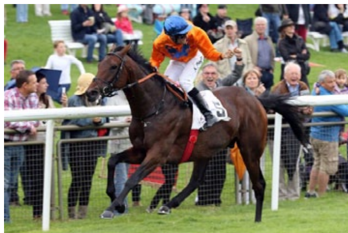
Wild Chief bei seinem Gruppe II-Sieg in Hannover.

Der sechsjährige Wild Chief gewann gleich beim Jahresdebut den Preis von Dahlwitz (LR) über 2000 Meter in Hoppegarten und in Dortmund den Großen Preis der Wirtschaft (Gr. III) über 1750 Meter. Weitere Aufgaben, auch einmal über 2400 Meter, erwiesen sich als zu schwer und auch im vergangenen Jahr konnte er sich bei drei Starts, u.a. im Prix Ganay (Gr. I) und im Prix d'Ispahan (Gr. I) nicht mehr profilieren. Am Ende summierten sich vier Siege und eine Reihe von guten Platzierungen, teilweise auch auf Distanzen, die vielleicht gar nicht so sein Ding waren.