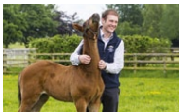
LEADING TO SUCCESS

Applications 2019 Wednesday, 2 January to Monday, 11 February, 2019